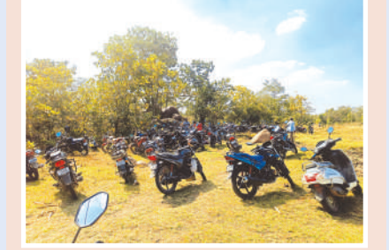
ప్రభుత్వం, అధికారులు స్పందించి కస్తోడియన్ భూములను పేదలకు పంపిణీ చేయాలి.

లక్ష్మీపూర్ శివారులోని కస్తోడియన్ భూములను నిరుపేదలకు పంపిణీ చేయాలని పలుమార్లు పేదలు, సీపీఐ నాయకులు డిమాండ్ చేసినప్పటికీ ఎలాంటి స్పందన లేకపోవడంతో గత నాలుగు రోజులుగా సీపీఐ పార్టీ ఆధ్వర్యంలో కస్తోడియన్ భూములను చదును చేస్తున్నారు. శివ్వంపేట, నర్సాపూర్ మండలాలకు చెందిన నిరుపేదలు వందలాది మంది ప్రతీరోజు ఈ ప్రాంతానికి చేరుకొని పొదలను, చిన్నచిన్న చెట్లను తొలగిస్తున్నారు. అయినా అధికారులు, పాలకులు స్పందించక పోవడం విడ్డూరంగా ఉంది.