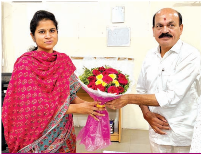
సంగారెడ్డి జిల్లా కలెక్టర్ వల్లూరు క్రాంతిని స్థానిక ఎమ్మెల్యే చింత ప్రభాకర్ శనివారం ముర్యాద పూర్వకంగా కలిసి నూతన సంవత్సర శుభాకాంక్షలు తెలిపారు. నియోజకవర్గ అభివృద్ధి పనులపై ఎమ్మెల్యే కలెక్టర్ తో చర్చించారు. నియోజకవర్గంలో పెండింగ్ లో ఉన్న పనులను పూర్తిచేయాలని కలెక్టర్ ను కోరారు. గత ప్రభుత్వంలో మంజూరైన నిధులను విడుదల చేయాలని ఎమ్మెల్యే కోరారు. - సంగారెడ్డి, (సిరి సూన్యన్)