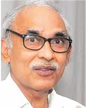
రోజులుగా ఆందోళన చేస్తున్నారన్నారు. ప్రభుత్వం వెంటనే వారి డిమాండ్ లపై దృష్టిసారించాలన్నారు. కస్తూర్బా ఉద్యోగులను చర్యలకి పిలిచి ప్రభుత్వం మాట్లాడాలన్నారు.

బీజేపీ ప్లాన్ చేస్తుందన్నారు. ఈ ఫార్ములా కేసులో అవినీతి జరిగితే త్వరగా విచారణ చేసి చర్యలు తీసుకోవాలన్నారు. జమిలి క్యూల కోసమే సావిత్రి బాయి పూలే జయం తిని ఉమెన్ టీచర్స్ డే గా ప్రభుత్వం ప్రకటించిందన్నారు. మంత్రులు కస్తూర్బా ఉద్యోగుల సమ్మెను విచ్ఛిన్నం చేయాలని చూస్తున్నారన్నారు. పంజాబ్ లో గత 39 రోజులుగా రైతులు ఉద్యమం చేస్తున్నారన్నారు. దలేవాల అనే రైతు నాయకుడు ఆస్పత్రిలోను నిరాహార దీక్ష చేస్తున్నారన్నారు. కేంద్ర ప్రభుత్వం రైతుల ఆందోళనలపై స్పందించకపోవడం దారుణమన్నారు. 2022లో జరిగిన ఉద్యమం సందర్భంగా కనీస గిట్టుబాటు ధర ఇస్తామని కేంద్రం చెప్పిందన్నారు. కానీ కేంద్రం ఇప్పటివరకు ఎటువంటి స్పష్టత ఇవ్వలేదన్నారు. కోర్టు కేంద్ర ప్రభుత్వానికి మొట్టికాయలు చేసిన ఎటువంటి ఉలుకుపాలుకు లేదన్నారు. కస్తూర్బాగాంధీ ఉద్యోగులు గత 2.5