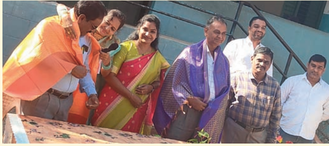
సమావేశంలో మాట్లాడుతున్న డీఈవో