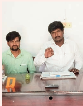
ఉండని, అదేవిధంగా సానిక ప్రజాప్రతినిధులు ఎంపీ ఎమ్మెల్యేలు వారి పక్షాన పోరాడి వారికి మద్దతు తెలియజేయాలని కోరుతున్నాము. తమకు దక్కాల్సిన సదుపాయాలను అందించని పక్షంలో పెద్ద ఎత్తున పోరాటం చేస్తామని అన్నారు.

సమానంగా పని చేస్తున్నా కాంట్రాక్ట్ కార్మికులను చులకన చేసి వారికి దక్కాల్సిన ఫలితం ఇవ్వకపోవడం చాలా బాధాకరం. కొన్ని సంవత్సరాలుగా పని చేస్తున్న కనీసం టీ నెంబర్ కూడా ఇవ్వక పోవడం చాలా బాధాకరం. కేంద్ర ప్రభుత్వం అమలు చేసిన చట్టం ప్రకారం ప్రతి కార్మికుడికి 20 వేలకు పైగా వేతనం ఇవ్వాలి. కానీ కార్మికుల పొట్ట కొడుతూ వారి రక్షణ పీల్చుకొని వారి కష్టాన్ని పై బ్రతుకుతున్నారు. పరిశ్రమలో పర్మి నెంట్ కార్మికులతో సమానంగా పనిచేస్తున్న కాంట్రాక్ట్ కార్మికులకు సరైన సదుపాయాలు కల్పించడంలో యాజమాన్యం పూర్తిగా విఫలమైందని ఆయన అన్నారు. ఇప్పటికైనా కాంట్రాక్ట్ కార్మికులు అందరూ ఏకమై తమ హక్కుల గురించి పోరాడుతున్న గంగోజీపేట రవికి పూర్తి మద్దతు తెలిపి తమ హక్కులను సాధించుకోవాల్సిన అవసరం ఎంతైనా