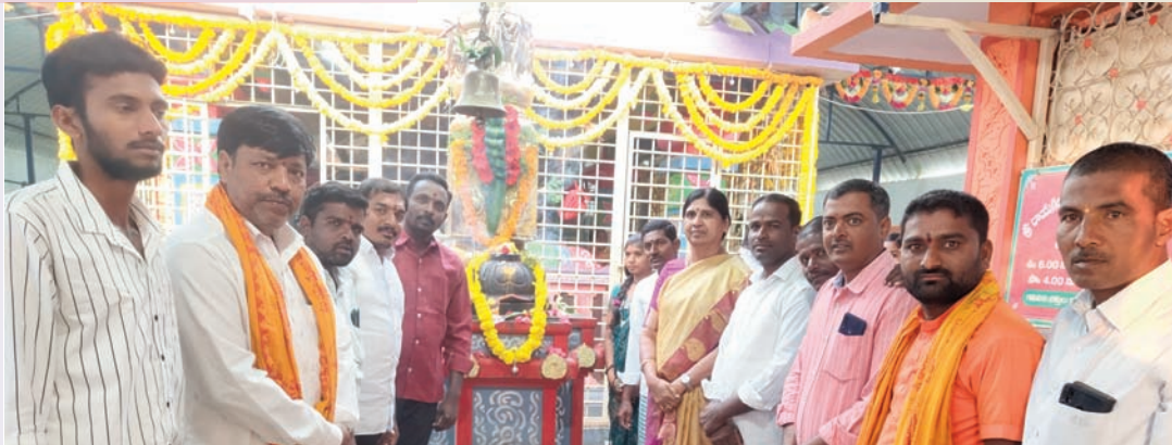
విప్లావం చేశారు ఆలయ ప్రాంగణంలో భజన సాంస్కృతిక కార్యక్రమాలు ప్రత్యేకంగా నిలిచాయి వైకుంఠ ఏకాదశిని పురస్కరించుకొని నిర్వాహకులు ఆలయాన్ని రకరకాల పుష్పాలతో విద్యుత్ దీపాలతో అందంగా అలంకరించారు.

కౌడిపల్లి జనవరి 10 (సిరి న్యూస్): వైకుంఠ ఏకాదశి మహా పర్వదినాన్ని పురస్కరించుకొని భక్తులు అత్యంత భక్తిశ్రద్ధలతో జరుపుకున్నారు శుక్రవారం మండల పరిధిలోని వెల్మకన్నా గ్రామంలో వెలిసిన శ్రీ రాయగిరి వెంకటేశ్వర స్వామి ఆలయంలో ఉత్తర ద్వారా దర్శనం చేసుకున్నార ముందుగా ఆలయ పూజారులు రాఘవేంద్ర, శ్రీనివాస్, సాయి, స్వామి వారికి పంచామృతాభిషేకం, ప్రత్యేక అలంకరణ పూజలు నిర్వహించి భక్తులకు దర్శనం కల్పించారు వివిధ గ్రామాల నుండి భారీగా తరలివచ్చిన భక్తులు ఉత్తర ద్వారా దర్శనం చేసుకున్నారు ఆలయ కమిటీ భజన మండలి భక్తుల కోసం అన్ని