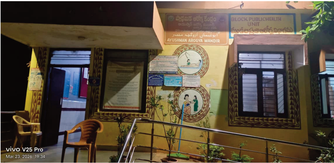
vivo V25 Pro Mar 23, 2026, 19:34