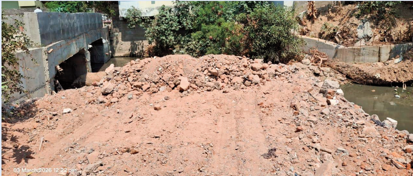
03 March 2026 12:22 pm

గురయ్యే ప్రమాదం ఉందని స్థానికులు ఆందోళన వ్యక్తం చేస్తున్నారు. ఇప్పటికే పలుమార్లు ఫిర్యాదులు చేసినప్పటికీ అధికారులు పట్టించుకోకపోవడం పరిస్థితిని మరింత విషమంగా మారుస్తోందని వారు అంటున్నారు.