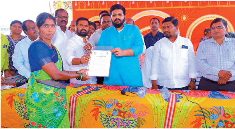
కళ్యాణ లక్ష్మి, షాదీ ముబారక్ పథకాలు