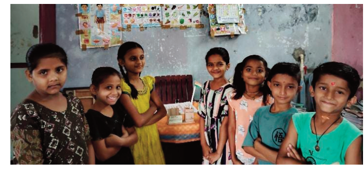
అభినందించారు. ఇలాంటి ఫలితాలు విద్యార్థులకు ప్రేరణగా నిలుస్తాయని అభిప్రాయపడ్డారు.