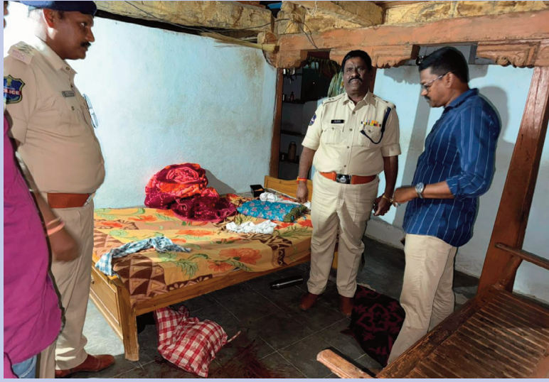
రామాయంపేట, (జంగరాయి) మార్చి 25 (నిరూపణ)