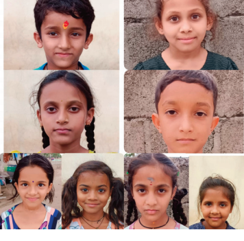
ఆకాంక్షించారు. తల్లిదండ్రులు కూడా తమ పిల్లల విజయంపై ఆనందం వ్యక్తం చేస్తూ పాఠశాల బోధనని అభినందించారు. ఇలాంటి ఫలితాలు విద్యార్థులకు ప్రేరణగా నిలుస్తాయని అభిప్రాయపడ్డారు.

సిరి న్యూస్, కాగజ్జగల్: సిర్పూర్ నియోజకవర్గ పరిధిలోని ప్రభుత్వ, గురుకుల పాఠశాలలకు చెందిన విద్యార్థులు 5వ తరగతి రాత పరీక్షలో ప్రతిభ కనబరచారు. ఇటీవల విడుదలైన ఫలితాల్లో పలువురు విద్యార్థులు అత్యుత్తమ మార్కులు సాధించి సత్కా చాటారు. గ్రామీణ ప్రాంతాలకు చెందిన విద్యార్థుల సైతం పోటీగా నిలిచి మెరుగైన ఫలితాలు సాధించడం విశేషంగా నిలిచింది. కష్టపడి చదవడం, ఉపాధ్యాయుల మార్గదర్శనం, తల్లిదండ్రుల ప్రోత్సాహంతోనే ఈ విజయాలు సాధ్యమయ్యాయని విద్యార్థులు తెలిపారు. ఈ సందర్భంగా పాఠశాల ఉపాధ్యాయులు విద్యార్థులను అభినందిస్తూ భవిష్యత్తులో మరింత ఉన్నత లక్ష్యాలను సాధించాలని