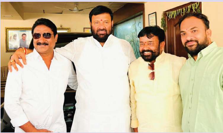
(సిరి న్యూస్) మేడ్చల్ మల్కాజ్జిల మార్చి 25

శ్రీరామనవమి సందర్భంగా కుత్బుల్లాపూర్ నియోజక వర్గ పరిధిలోని పలు దేవాలయాలలో నిర్వహిస్తున్న శ్రీరామనవమి సందర్భంగా హనుమాన్ ఆలయాల్లో నిర్వహించే సీతారాముల కల్యాణ ఉత్సవాలలో ముఖ్య అతిథిగా పాల్గొని విజయవంతం చేయాలని భక్తులు ఆలయ కమిటీ సభ్యులు పేర్కొన్నారు కార్యక్రమంలో స్థానిక కాంగ్రెస్ పార్టీ కార్యకర్తలు ఆలయ కమిటీ సభ్యులు బస్టి వాసులు పాల్గొన్నారు