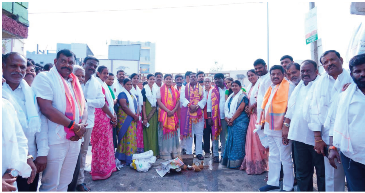
79 లక్షల వ్యయంతో సిసి రోడ్డు