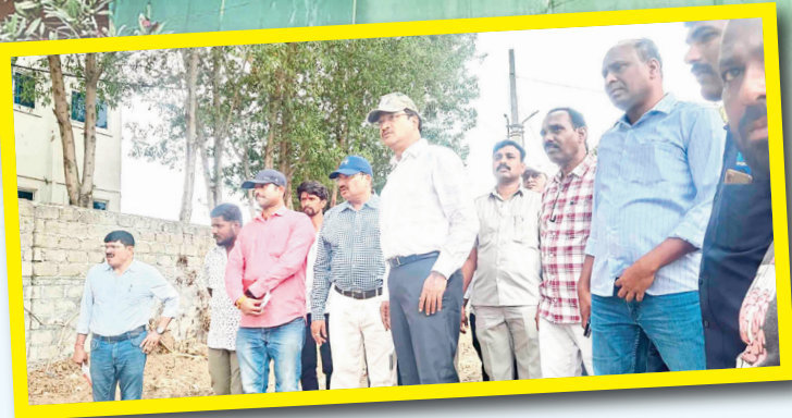
రెయిన్వో మెడోస్ కొత్త నిర్మాణాలకు శ్రీకారం

రూ.20 కోట్ల భూమిని మింగిన రెయిన్వో మెడోస్