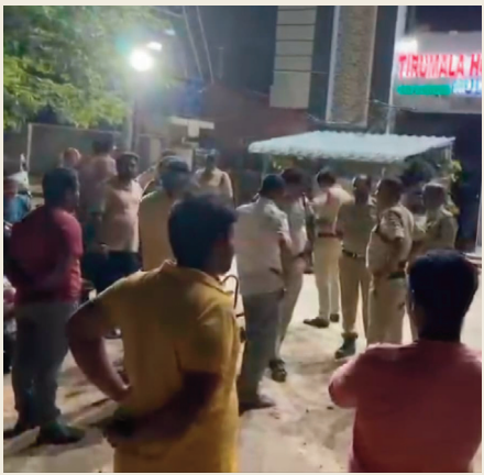
ఆసుపత్రి మార్పురీకి తరలించారు. పోస్టుమార్టం నివేదిక వచ్చిన తర్వాత మరణానికి గల అసలు కారణాలు తెలుస్తాయని, బాధ్యులపై కఠిన చర్యలు తీసుకుంటామని పోలీసులు హామీ ఇచ్చారు.

యినా, అనుభవం లేని డాక్టర్లతో వైద్యం అందించడం వల్లనే ఈ అనర్థం జరిగిందని నినదించారు. ఎంతో భవిష్యత్తు ఉన్న యువతిని పొట్టన పెట్టుకున్నారని, యాజమాన్యం సమాధానం చెప్పాలని డిమాండ్ చేశారు. ఆసుపత్రి వద్ద భారీగా గుమిగూడిన జనాన్ని నియంత్రించడం పోలీసులకు కష్టతరమైంది.