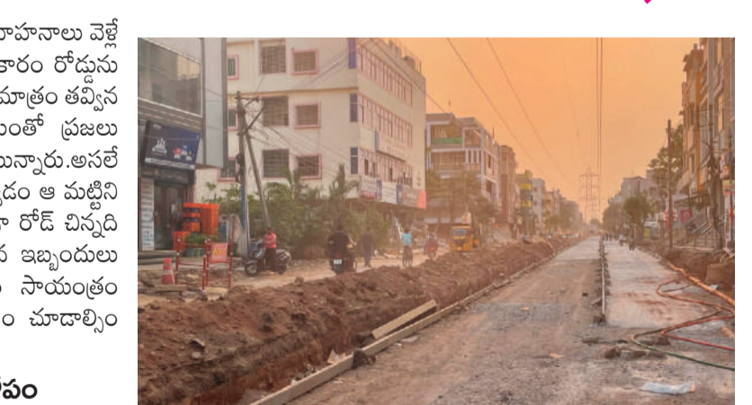
అధికారుల పర్యవేక్షణ లోపం

జరుగుతోంది. నిత్యం వేలాది వాహనాలు వెళ్లే ఈ దారిలో ఒక ప్రణాళిక ప్రకారం రోడ్డును తవ్వాలి ఉండగా కాంట్రాక్టర్ మాత్రం తవ్విన మట్టిని ఇంకోవైపు వేస్తుండటంతో ప్రజలు తీవ్ర ఇబ్బంది ఎదుర్కొంటున్నారు. అసలే ఒకవైపు సీసీ కోసం రోడ్ తవ్వడం ఆ మట్టిని మరోవైపు వేయడం మూలంగా రోడ్ చిన్నది కావడంతో రాకపోకలకు తీవ్ర ఇబ్బందులు ఎదురవుతున్నాయి. ఉదయం సాయంత్రం ఈ దారిలో వెళ్లాలంటే నరకం చూడాల్సిందేనని ప్రజలు వాపోతున్నారు.