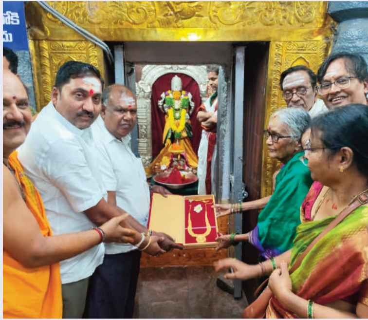
ఆమీన్ ఫూర్ ఏప్రిల్ 25 సిరి న్యూస్