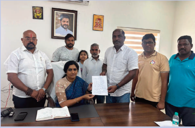
రామచంద్రపురం, ఏప్రిల్ 04 (సిరి న్యూస్):