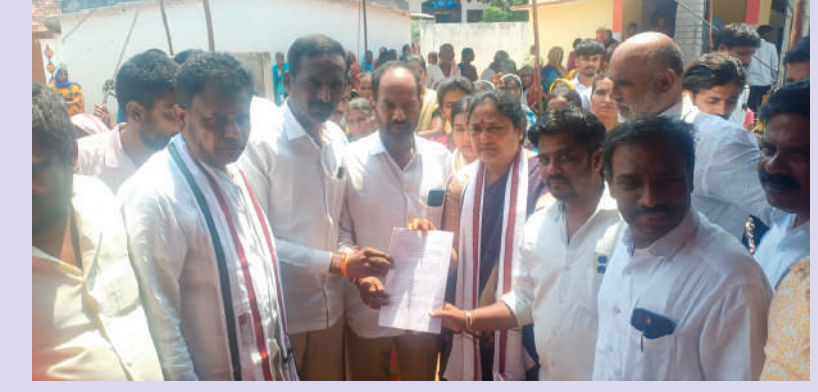
(సిరి న్యూస్ )కొండాపూర్ ఏప్రిల్ 4: