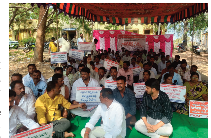
వర్కర్లను, పోల్ టు పోల్ వర్కర్లను ఎఫ్ ఓ సి వర్కర్లను కూడా విద్యుత్ సంస్థలను విలియం చేసుకోవాలని