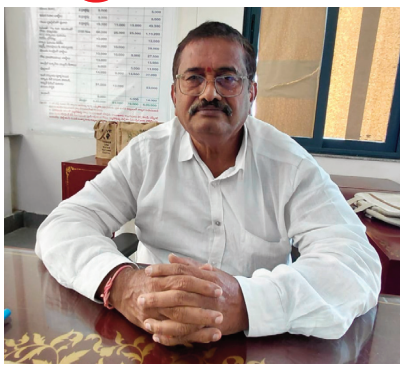
కతను ఉపయోగించారు. సాబు నిర్మాణంలో ఫిల్టర్ రూఫింగ్ విధానాన్ని వినియోగించారు. ఇందులో సాధారణ ఇళ్లతో పోలిస్తే స్టాబ్ నిర్మాణంలో 40 శాతం ఖర్చు ఆదా అవుతుంది. నాణ్యతలో కూడా ఎలాంటి లోటుపాట్లు లేకుండా పకడ్బందీగా పూర్తి చేశారు. దీర్ఘకాలం పాటు నిలిచి ఉండేలా రాష్ట్ర ప్రభుత్వం నిర్ణయించిన ఆర్థిక సహాయం లోనే ఇంటి నిర్మాణాన్ని చేశారు.

ఇందిరమ్మ ఇంటి నిర్మాణంలో ప్రజా ప్రభుత్వం పూర్తి సహకారం అందిస్తుంది. నిర్మాణానికి అవసరమైన ఇసుక అందుబాటులో పెట్టి ఉచితంగా అందిస్తుంది. ఇంటి నిర్మాణానికి ఒక్కో దశలో అవసరమైన ఇసుక కోసం సంబంధిత గ్రామ పంచాయతీ కార్యదర్శి, మున్సిపాలిటీల పరిధిలో వార్డ్ ఆఫీసర్లు తమ తహశీల్దార్ దృష్టికి ముందస్తుగా తీసుకెళ్లాలి. ఇసుక ఉచితం.. రవాణా ఛార్జీలు నిర్మాణదారులు చెల్లించాల్సి ఉంటుంది. నిరుపేదలకు పెట్టుబడి లేని పక్షంలో స్వయం సహాయక మహిళా సంఘాలు, మెప్పా ద్వారా రూ.లక్ష రుణం అందించే ఏర్పాట్లు చేసింది.