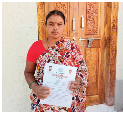
ప్రజా ప్రభుత్వం సహకారం..