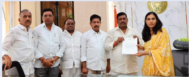
రామచంద్రపురం, ఏప్రిల్ 8 (సిరి న్యూస్):

జిల్లా కలెక్టర్ కు ఎమ్మెల్యే గూడెం మహిపాల్ రెడ్డి వినతి నిధులు కేటాయించకపోతే ప్రజా ఉద్యమం హెచ్చరిక