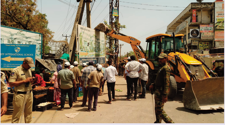
జనారం ఏప్రిల్ 08 సిరి న్యూస్

అమీన్ పూర్ జిహెచ్ఎంసీ సర్కిల్ బోర్డారం గ్రామంలో రహదారుల విస్తరణకు మరియు ట్రాఫిక్ క్రమబద్ధీకరణలో భాగంగా భారీ ఎత్తున అక్రమణలు తొలగింపు, అమీన్పూర్ సర్కిల్ టౌన్ ప్లానింగ్ బృందం స్థానిక పోలీస్ మరియు ట్రాఫిక్ పోలీస్ విభాగల సమన్వయంతో ఈ డ్రైవ్ నిర్వహించారు అని తెలిపారు. టౌన్ ప్లానింగ్ అధికారి మాట్లాడుతూ... ట్రాఫిక్ కు అడ్డుగా ఉన్న అక్రమణలను క్లియర్ చేయడం జరిగిందని తెలిపారు. రోడ్లపైకి చొచ్చుకు వచ్చిన తాత్కాలిక రేకుల షెడ్ల మరియు మెట్లు దుకాణాల బోర్డులు పైకీలు తాత్కాలిక నిర్మాణాలను పూర్తిగా తొలగించి రోడ్లను క్లియర్ చేశామని తెలిపారు. ఈ డ్రైవ్ లో మొత్తం 86 అక్రమణలను తొలగించామని తెలిపారు.