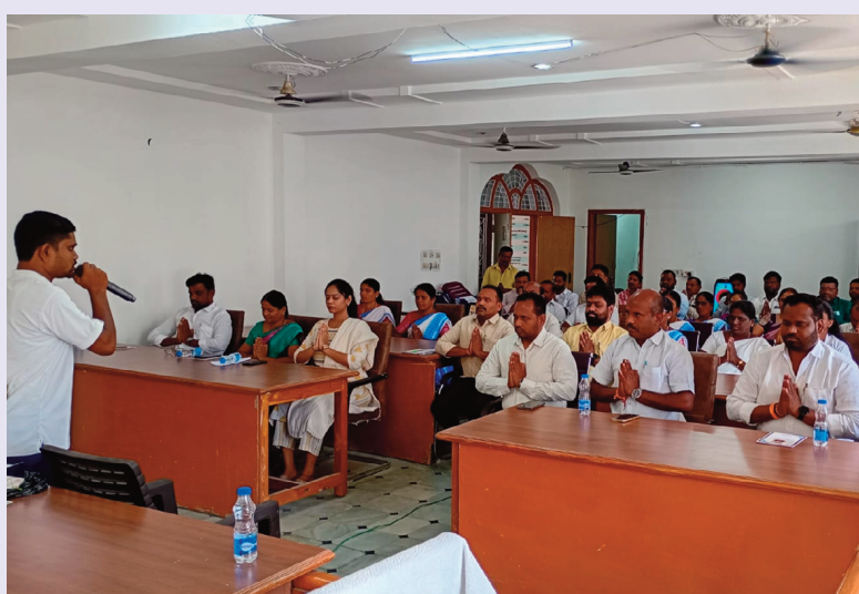
రామాయంపేట, ఏప్రిల్ 10 (సెలెక్టర్)