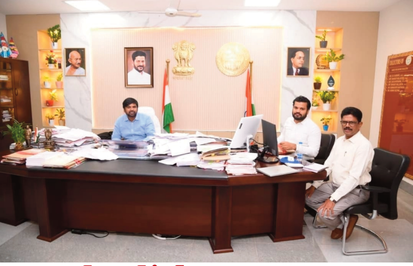
జిల్లా కలెక్టర్ కుమార్ దీపక్