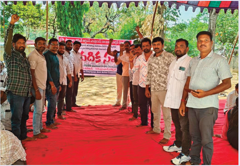
హైదరాబాద్, ఏప్రిల్ 10, సెలెక్టర్

• ఇదే తీరు కొనసాగితే ఆర్థికంగా సంస్థకు సరఫరాలో ప్రజలకు తిప్పలు తప్పవు!