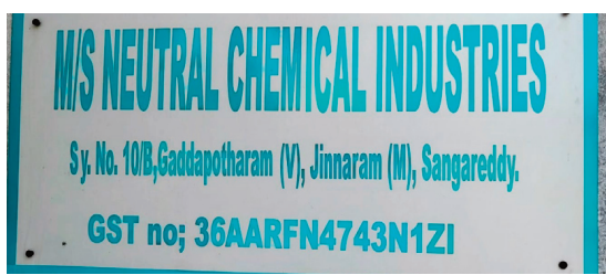
జన్నారం ఏప్రిల్ 10 సెలెక్టర్