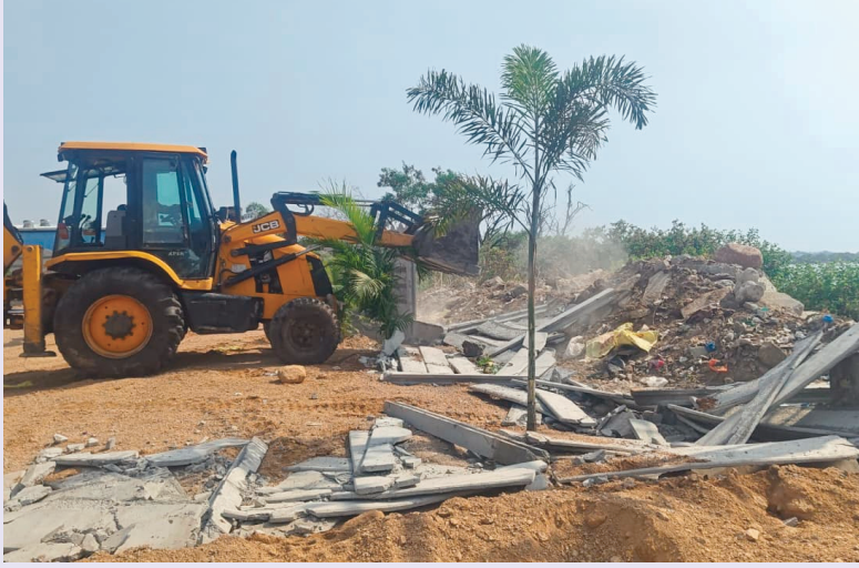
అమీన్ పూర్ ఏప్రిల్ 10 సెలెక్టర్

అమీన్ పూర్ పెద్ద చెరువు పరిధిలోని సర్వేనెంబర్ 176 లో చెరువును పూడ్చి రాత్రికి రాత్రి మట్టి పోసి అక్రమ నిర్మాణాలు చేపడుతున్నారని, సమాచారం మేరకు రెవెన్యూ అధికారులు శుక్రవారం కూల్చివేతలు చేపట్టారు. పెద్ద చెరువు ఎఫ్ఐఎల్ బఫర్ జోన్ లో కట్టాలు చేసి అక్రమ నిర్మాణాలు చేపడితే క్రిమినల్ కేసులు నమోదు చేస్తామని తెలిపారు. ఈ కూల్చివేత కార్యక్రమంలో ఆర్ ఐ సంగీత సిబ్బంది తదితరులు పాల్గొన్నారు.