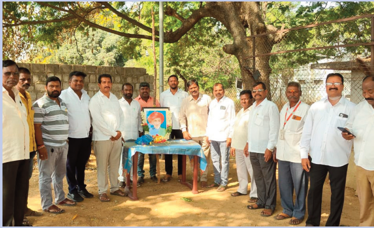
రామచంద్రపురం, ఏప్రిల్ 11, (సిరి న్యూస్):