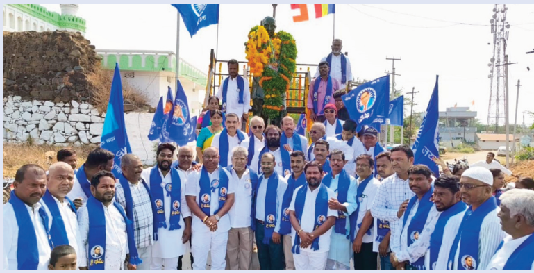
జోగిపేట, ఏప్రిల్ 14, (సిరి న్యూస్):