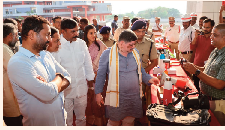
సంగారెడ్డి, ఏప్రిల్ 14 (సిరి న్యూస్)