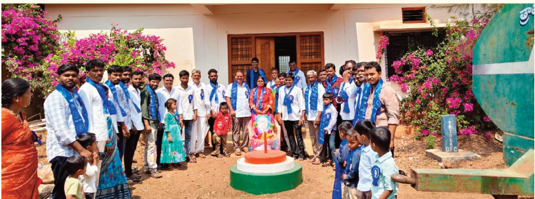
ఝరానంఘం, ఏప్రిల్ 14 (సిరి న్యూస్)

భారత రాజ్యాంగ శిల్పి, భారతరత్న డాక్టర్ భీష్మాచార్య రాంజీ అంబేద్కర్ 135వ జయంతిని పురస్కరించుకునే సేద ఝరానంఘం మండలంలో పండుగ వాతావరణం నెలకొంది. సామాజిక సమానత్వం కోసం ఆయన చేసిన పోరాటాన్ని స్ఫూర్తిగా ప్రతి గ్రామంలో ఘనంగా నివాళులు అర్పించారు. బడుగు బలహీన వర్గాల కొరత ఆయన చేసిన సేవ మరువలేదని అంబేద్కర్ జయంతి కేవలం ఒక పుట్టినరోజు వేడుక మాత్రమే కాదు, అది సామాజిక విప్లవానికి ఒక స్ఫూర్తి. ఆయన ఆశయాల సాధనలో ప్రతి పౌరుడు భాగస్వామి కావాలి అన్నది ఆ మహనీయుడికి మనమిచ్చే అసలైన నివాళి. ఈ దేశంలో పుట్టిన ప్రతిపౌరుడికి సమానమైన హక్కులను కల్పించి, ప్రజలలో మనముతా ఒక్కటే అనే భావాన్ని కలిగించారు. స్వతంత్ర భారతదేశానికి మొట్టమొదటి న్యాయ శాఖ మంత్రిగా పదవి చేపట్టారు అందుకే ఈ రోజును సామాజిక న్యాయ దినోత్సవంగా కూడా జరుపుకుంటారు. తన జీవితాంతం సామాజిక మార్పు కోసం పోరాడిన ఆయన, మనుషుల మధ్య విభేదాలు లేని సమాజం కోసం 1956లో లక్షలాది మంది అనుచరులతో కలిసి బౌద్ధ మతాన్ని స్వీకరించారు. మహిళా హక్కుల కోసం ఏర్పాటు చేసిన బిల్లుకు వ్యతిరేకత రావడంతో తన మంత్రి పదవిని వదిలేసి మహిళల పట్ల నిబద్ధత చాటుకున్న మహనీయుడు అంబేద్కర్.