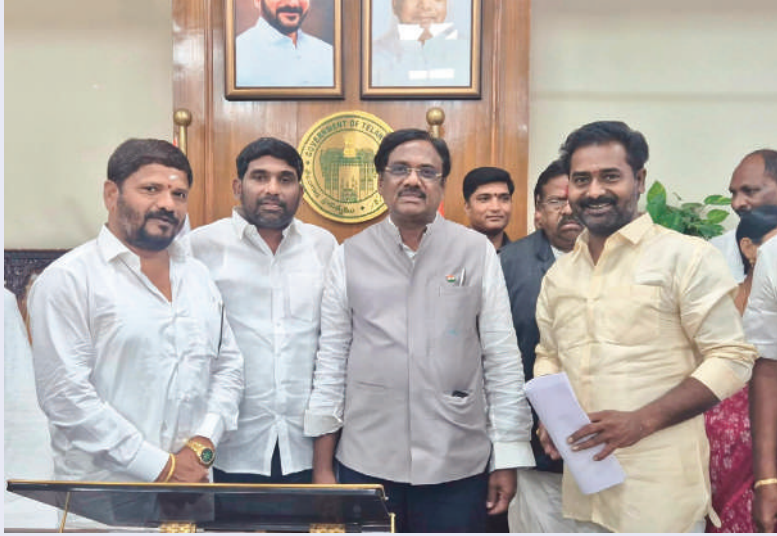
రామచంద్రపురం, ఏప్రిల్ 18 (సిరి న్యూస్):