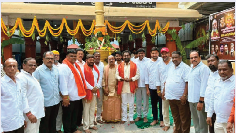
రామచంద్రపురం, ఏప్రిల్ 18 (సిరి న్యూస్):