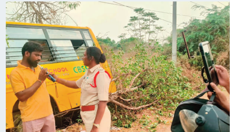
కొంపల్లి ఏప్రిల్ 18 (సిరి న్యూస్)