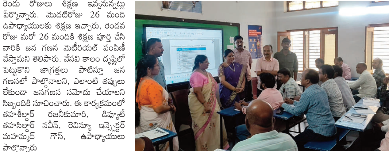
రామాయంపేట, ఏప్రిల్ 18 (సిరి న్యూస్)