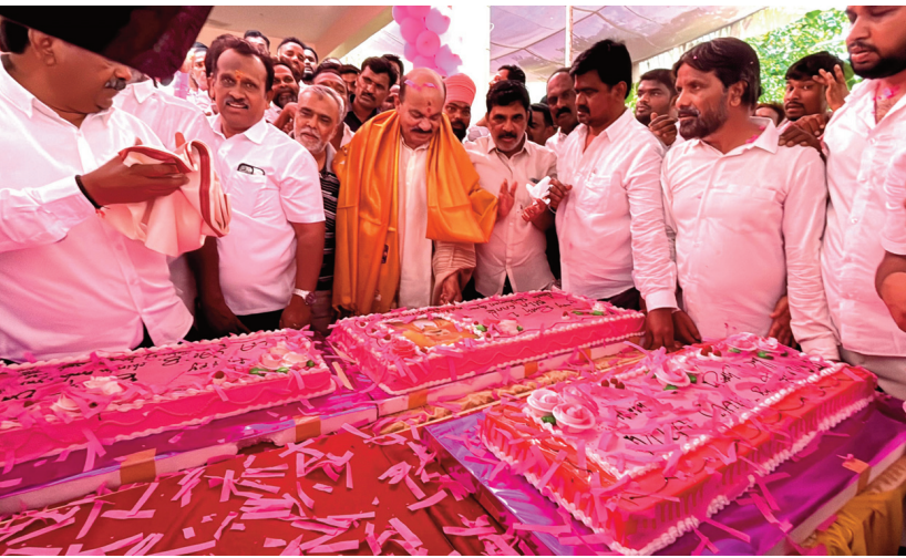
సంగారెడ్డి, ఏప్రిల్ 21 (సిరి స్ట్యాన్):