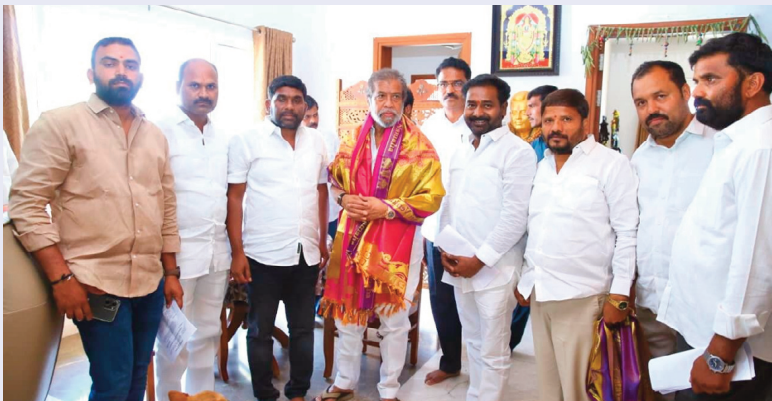
రామచంద్రపురం, ఏప్రిల్ 21