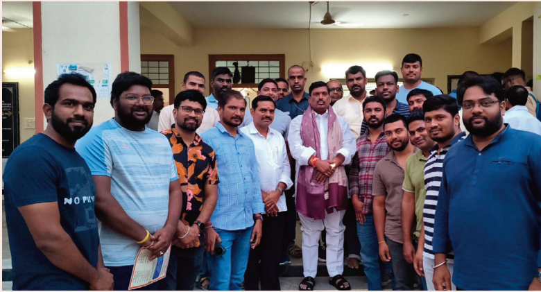
అమీన్ పూర్ ఏప్రిల్ 21 సెల్యూన్

ఎస్పీపీ ప్లాంట్ తరలింపు నిర్ణయంపై హర్షం ఎమ్మెల్యేకు అభినందనలు తెలిపిన కాలనీ ప్రజలు