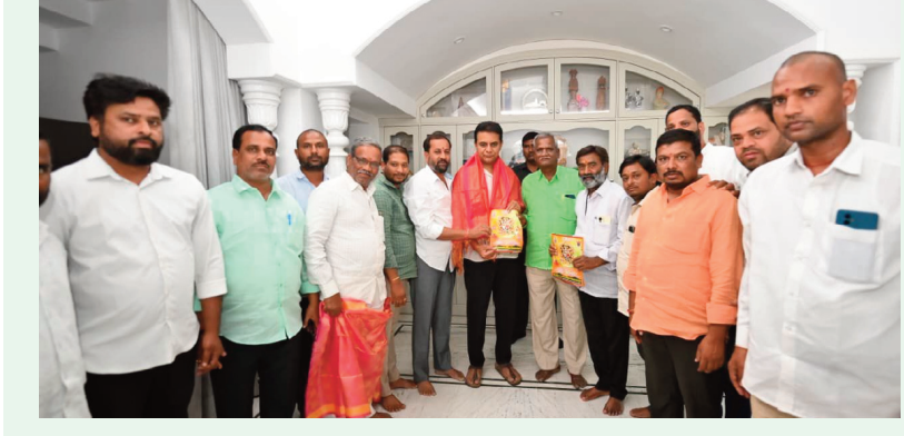
కొండాపూర్, ఏప్రిల్ 22