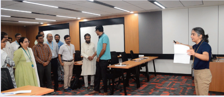
రామచంద్రపురం, (పటాన్వేర), ఏప్రిల్ 22, (సిరి న్యూస్):