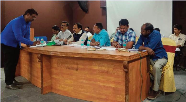
రామచంద్రపురం, (పటాన్-చెరు), ఏప్రిల్ 24, (సిరి స్టూన్):

వారంలోగా మ్యాపింగ్ పూర్తి చేయాలని ఆదేశాలు