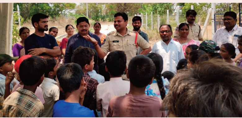
రామాయంపేట, (నిజాంపేట) ఏప్రిల్ 27 (సిరి న్యూస్):