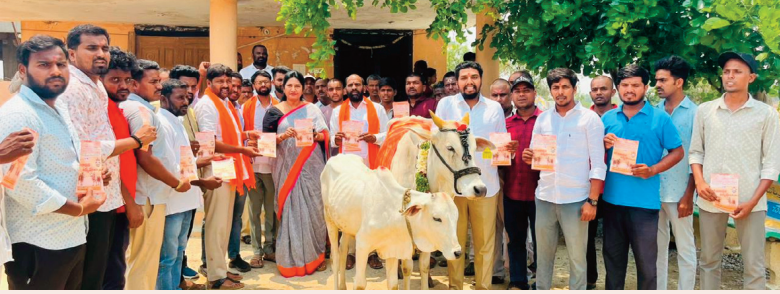
హత్వూర్, ఏప్రిల్ 27, (సిరి న్యూస్)