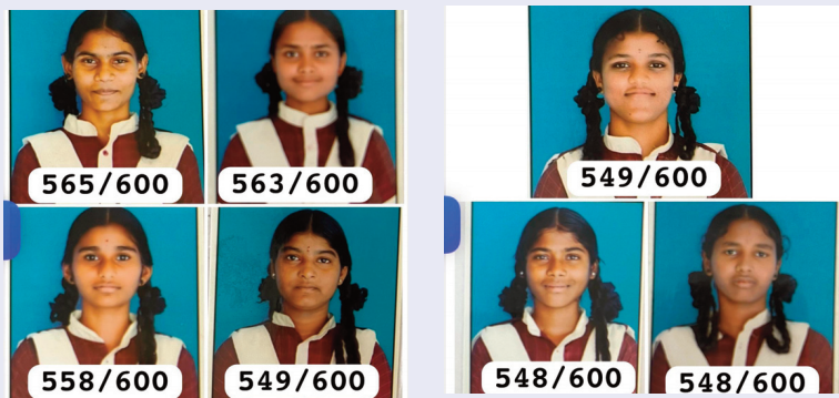
కులూరం ఏప్రిల్ 29, (సిరి న్యూస్)