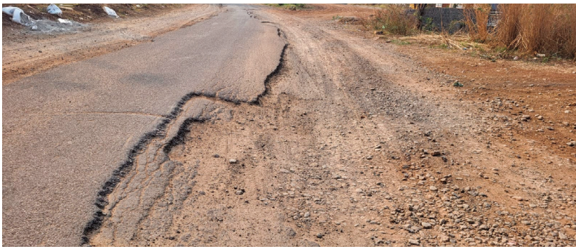
దారులు అవేదన వ్యక్తం చేస్తున్నారు.