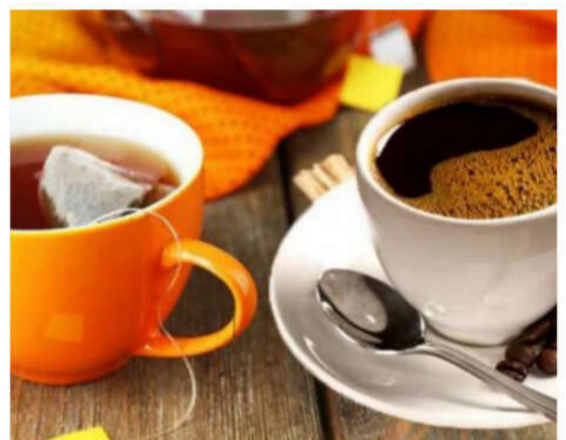
దీని వల్ల ఆ పాజిటివ్ వైబ్స్ రోజంతా ఉంటాయి.

ఇంటి నుంచి బయటలు దేరి సొసైటీలోకి వెళితాం కదా. అలా బయటకు వెళ్ళిన తర్వాత మొదటిసారి మీరు కలుసుకున్న పరిచయస్తుడితో మీరు చాలా పాజిటివ్ గా మంచి విషయాలను మాట్లాడేందుకు ప్రయత్నించండి. వారు మీ పొరుగింటి వారు కావచ్చు. ఆఫీసులో మీ కొలీగ్ అయి ఉండొచ్చు. వారితో కొంత మంచి సంభాషణను చేయండి.