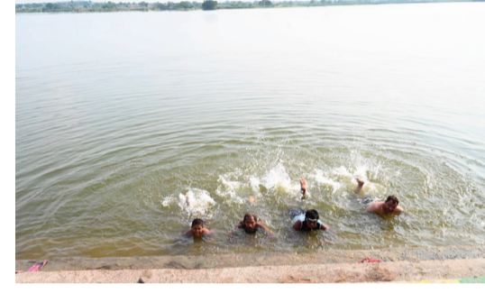
ఉల్లాసాన్ని తీసుకొస్తున్నాయి. అయితే చెరువులో ఈత కొట్టే సమయంలో జాగ్రత్తలు తప్పనిసరిగా పాటించాలని గ్రామ పెద్దలు సూచిస్తున్నారు. లోతైన ప్రాంతాలకు వెళ్లకుండా అప్రమత్తంగా ఉండాలని, చిన్నారులు పెద్దల పర్యవేక్షణలోనే నీటిలోకి దిగాలని హెచ్చరిస్తున్నారు. జిల్లా భగ్గుమంటున్న ఎండలకు ఎన్నాన్ పల్లి చెరువు చల్లని ఊరటనిస్తూ, యువత సందడితో గ్రామంలో కొత్త ఉత్సాహాన్ని నింపుతోంది.

అభిందమే కాకుండా మానసిక ప్రశాంతత కూడా కలుగుతోందని యువకులు చెబుతున్నారు. చిన్నారులు, యువత చెరువులో ఈత కొడుతూ కనిపిస్తున్న దృశ్యాలు గ్రామంలో వేసవి సంబరాలను తలపిస్తున్నాయి. ఈత అనేది కేవలం వినోదమే కాకుండా శరీరానికి ఆత్మశ్రమ వ్యాయమని వైద్య నిపుణులు సూచిస్తున్నారు. ఈత వల్ల శరీరంలోని ప్రతి భాగానికి వ్యాయామం అందడంతో పాటు కండరాలు దృఢంగా మారుతాయని, గుండె ఆరోగ్యం మెరుగుపడటంతో పాటు శ్వాసకోశ వ్యవస్థ బలపడుతుందని, మానసిక ఒత్తిడి తగ్గి ఉల్లాసం పెరుగుతుందని, రోజువారీ జీవితంలో ఉత్సాహం, చురుకుదనం పెరగడానికి ఈత ఎంతో ఉపయోగకరమని గ్రామ యువత అభిప్రాయ పడుతున్నారు. ఎండల తీవ్రత మధ్య చెరువు వద్ద నెలకొన్న ఉత్సాహభరిత వాతావరణం గ్రామ ప్రజలను ఆకట్టుకుంటోంది. ఒకవైపు చల్లని నీరు ఉపశమనాన్ని అందిస్తుండగా, మరోవైపు యువత కేరింతలు కొత్త