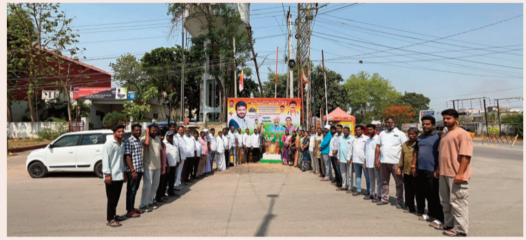
రామాయంపేట, మే 21 (సరి న్యూస్)