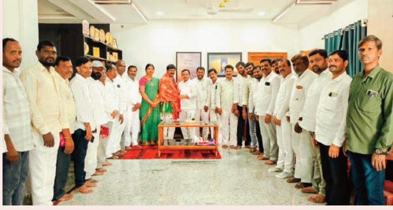
శివపేట మే 5 (సిరి న్యూస్)

నర్సాపూర్ ప్రభుత్వ ఆసుపత్రిలో పండ్లు పంపిణీ!!