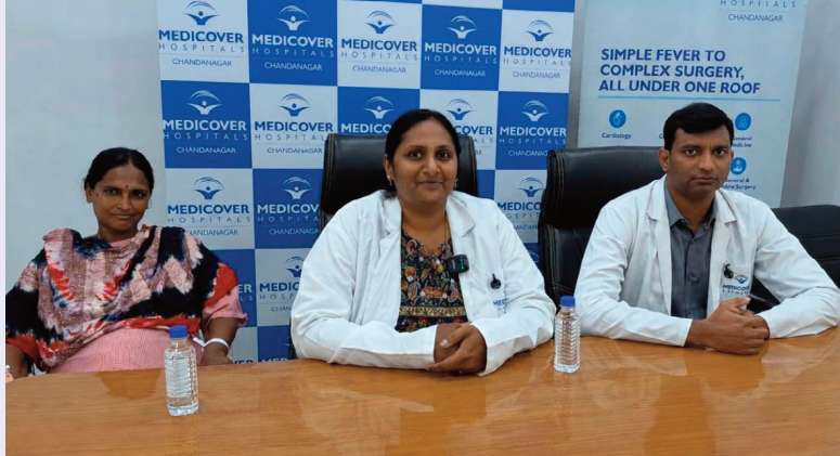
రామచంద్రపురం, మే 8, (సిరి న్యూస్):

యువతి ప్రాణాలను కాపాడిన మెడికల్ బృందం 20 సెం.మీ కణితిని తొలగించిన వైద్యులు