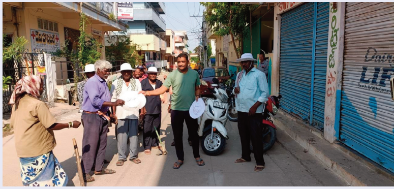
తూప్రాన్ మే 8 సిరి న్యూస్