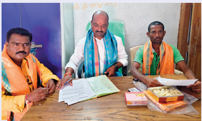
కొల్లూరం మే 8 (సిరి న్యూస్)