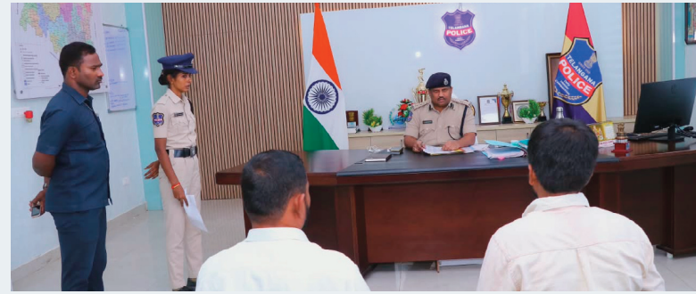
మెదక్, 11 (సిరి న్యూస్)