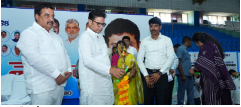
జాబ్ మేళాలో రంగారెడ్డి, వికారాబాద్, మేడ్చల్-మల్త్యాజిగిరి జిల్లాలకు చెందిన యువత భారీగా పాల్గొన్నారు. వివిధ సంస్థల ప్రతినిధులతో మాట్లాడి ఉద్యోగ అవకాశాలపై అవగాహన పొందారు. నైపుణ్యభివృద్ధి, పరిశ్రమల అవసరాలపై ప్రత్యేక సెషన్లు నిర్వహించారు. గ్రామీణ, పట్టణ ప్రాంతాల యువతకు సమాన

హైదరాబాద్, (సిరి న్యూస్): "తెలంగాణను దేశ నైపుణ్య రాజధానిగా తీర్చిదిద్దడమే ప్రభుత్వ లక్ష్యం" అని మంత్రి దుద్దికల్ శ్రీధర్ బాబు అన్నారు. "ప్రజాపాలన ప్రగతి ప్రణాళిక"లో భాగంగా సరూర్ నగర్ ఇండోస్ట్రీలలో నిర్వహించిన యువజన, క్రీడల జాబ్ మేళా-2026 కార్యక్రమంలో ఆయన పాల్గొన్నారు. ఈ సందర్భంగా మంత్రి మాట్లాడుతూ, యువతకు ఉపాధి అవకాశాలు కల్పించడంపై ప్రభుత్వం ప్రత్యేక దృష్టి పెట్టిందన్నారు. పరిశ్రమల అవసరాలకు అనుగుణంగా స్కెల్లింగ్, రీస్కెల్లింగ్, అప్ స్కెల్లింగ్ కార్యక్రమాలను విస్తృతంగా అమలు చేస్తున్నామని తెలిపారు. కొత్త ఉద్యోగ అవకాశాలకు అనుగుణంగా యువతను సిద్ధం చేయడమే ప్రభుత్వ లక్ష్యమన్నారు.