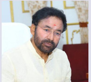
హైదరాబాద్, మే 11, (సిరి న్యూస్):

ప్రయాణికుల సేవలు, వస్తు రవాణాతోపాటు అత్యాచారాల సేవలు కల్పించడంతో నూతన సాంకేతికతలు, ఆవిష్కరణలతో దూసుకుపోతున్న భారతీయ రైల్వే ఇప్పుడు ఔషధాల రవాణాపై ప్రత్యేక దృష్టి సారించింది. ఇందులో భాగంగా ప్రతిష్టాత్మకంగా ప్రారంభించిన పీఎం గతిశక్తి కార్యక్రమానికి కొనసాగింపుగా ఫార్మా క్యాపిటల్ ఆఫ్ ఇండియా అయిన హైదరాబాద్ నుంచి ముంబైలోని జవహర్ లాల్ నెహ్రూ పోర్ట్ ట్రస్ట్ (జెఎస్ఐటీ) కు ఔషధాలను సరఫరా చేసేందుకు ఈనెల 2న ఔషధి ఎక్స్ ప్రెస్ సేవలతో దేశంలోనే తొలి ప్రత్యేక ఫార్మా రైలును ప్రారంభించడం పట్ల కేంద్ర బిగ్, గనుల శాఖ మంత్రి కిషన్ రెడ్డి ఒక ప్రకటనలో హార్షం వ్యక్తం చేశారు. ఈ మొదటి రెగ్యులర్ 'ఔషధి ఎక్స్ ప్రెస్'ను తెలంగాణకు కేటాయించినందుకు ప్రధానమంత్రి నరేంద్ర మోదీ, రైల్వే శాఖ మంత్రి అశ్వినీ వైష్ణవ్ కు ధన్యవాదములు తెలియజేశారు. ఫార్మా కంపెనీలకు కేంద్రమైన హైదరాబాద్ లో తరచూ ఔషధ ఫార్మా ఉత్పత్తులను దేశంలోని వివిధ ప్రాంతాలకు తరలింపడంతోపాటు అంత తర్యామింగా పంపిణీ చేసేందుకు ముంబై సమీపంలోని జవహర్ లాల్ నెహ్రూ పోర్ట్ ట్రస్టుకు తరలింపడం తప్పనిసరి. అందుకే హైదరాబాద్ ను, జెఎస్ఐటీ అనుసంధానిస్తూ ఈ ప్రత్యేక రిఫర్ రైలు క్రోస్ స్టాప్ చేసే పని గల రైలును ప్రారంభించడం హైదరాబాద్ ఫార్మా కంపెనీలకు ఎంతో మేలు కలగగలగలగల. దీంతోపాటు దేశవ్యాప్తంగా, వివిధ దేశాలకు సరైన సమయంలో ఔషధాలను చేరవేసేందుకు వీలు కలుగుతుంది. హైదరాబాద్ లోని జీసీఎమ్ వ్యాబీ, జీడిమెట్ల ఇండస్ట్రీలో ఏరియా, పటాన్ చెరులోని ఫార్మా జీసీ, మువ్వల్లోని పూజర్ సీబీ తదితర ప్రాంతాల్లో ఉత్పత్తయ్యే ఫార్మా ప్రొడక్ట్స్ సరఫరాకు ఈ రైలు వారా కీలకం కానుంది. దేశవ్యాప్తంగా తక్కువ ఖర్చులో