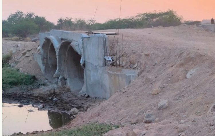
జిన్నారం మే 11 సిరిన్యాస్

జిన్నారం మండలం మాదారం గ్రామం ఎస్ఎన్ కుంట అలుగు, కాలువ పై రహదారి నిర్మాణం చేపట్టారు. కాలువకు మట్టి పోసి పైపులు వేసి రోడ్డుగా మార్చారు. గ్రామ సమీపంలో ఉన్న ఎస్ ఎస్ కుంట నిండడంతో కింది చెరువుకు నీటిని సరఫరా చేసే ఫీడర్ నాలా ఆ ప్రాంత సాగునీటి వ్యవస్థకు గుండెకాయ వంటిది. అలుగు, కాలువ ద్వారా భావనీ చెరువులోకి నీరు ప్రవహిస్తుంది. ఈ నాలా ద్వారానే కింది చెరువు నిండి, దాని కింద ఉన్న పండలాది ఎకరాల పొలాలకు సాగునీరు అందుతుంది. ఫీడర్ ఛానల్ కనుమరుగు ఒక్కప్పుడు నీటి ప్రవాహంతో కల కలలాడే నాలా ఇప్పుడు వాహనాలు తిరిగి రోడ్డుగా మారి తన ఉనికిని కోల్పోయింది. పరద ముప్పు, వర్షాకాలంలో కాలువ నిండినప్పుడు పైపుల గుండా నీరు వెళ్లకుండా చుట్టూకుక్కల పొలాల మునిగిపోయే ప్రమాదం ఉంది. పూడిక సమస్య కాలువమీద పైపులలో మట్టి చెత్త పేరుకుపోతే నీటి ప్రభావం పూర్తిగా ఆగిపోతుంది. నీటిని శుభ్రం చేయడం చాలా కష్టంగా మారనుంది. సహజ సిద్ధమైన కాలువను మూసివేయడం వల్ల భూగర్భ జలాలు తగ్గే అవకాశం ఉంటుంది. నాలా పునరుద్ధరణ తక్షణమే రెవెన్యూ మరియు ఇరిగేషన్ అధికారులు స్పందించి అక్రమంగా వేసిన రోడ్డును తొలగించి నాలాను యధాస్థితికి తీసుకురావాలని రైతులు డిమాండ్ చేస్తున్నారు.