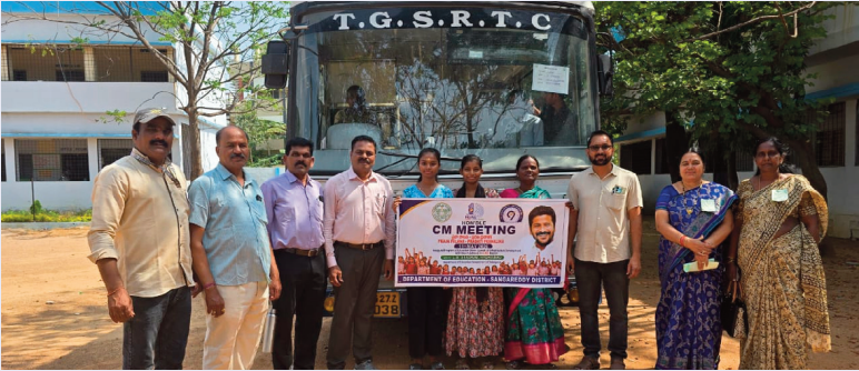
జనారం మే 11 సిరి న్యూస్

జిన్నారం మండల విద్యాధికారి విజయ్ కుమార్ ఆదేశాల మేరకు ప్రభుత్వ పాఠశాలల ప్రధాన ఉపాధ్యాయులు మరియు విద్యార్థులతో కలిసి ప్రజా పాలన ప్రగతి ప్రణాళిక మీటింగ్కు సోమవారం హైదరాబాద్ బయలుదేరారు. ప్రజా పాలన ప్రగతి ప్రణాళికలు భాగంగా ముఖ్యమంత్రి ఆధ్వర్యంలో సమావేశం నిర్వహణ. సమావేశానికి విద్యాశాఖ ఉన్నత అధికారులు హాజరవుతున్నారు. ప్రభుత్వ పాఠశాలల అభివృద్ధిపై చర్యలు జరగనున్నాయని తెలిపారు. విద్యార్థులకు డిజిటల్ క్లాసులు, మరియు విద్యాభివృద్ధి పై ఉపాధ్యాయులతో చర్చ జరగనున్నదని తెలిపారు. విద్యార్థులకు మెరుగైన సౌకర్యాల, కల్పనపై ప్రత్యేక సమావేశం నిర్వహించాలని తెలిపారు. ఈ కార్యక్రమంలో జిన్నారం మండల ఉపాధ్యాయులు, విద్యార్థులు, విద్యార్థుల తల్లిదండ్రులు మీటింగ్కు హాజరయ్యారు.