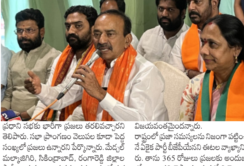
ప్రధాని సభకు భారీగా ప్రజలు తరలివచ్చారు తెలిపారు. సభ ప్రాంగణం వెలుపల కూడా పెద్ద సంఖ్యలో ప్రజలు ఉన్నారని పేర్కొన్నారు. మేడ్చల్ కంటోన్మెంట్ లోని గాయత్రి పార్క్ లో నిర్వహించిన మీడియా సమావేశంలో మాట్లాడిన ఈటల,

విజయవంతమైందన్నారు. రాష్ట్రంలో ప్రజా సమస్యలను నిజంగా పట్టించుకోనే వీక్షక పార్టీ బీజేపీయేనని ఈటల వ్యాఖ్యానించారు. తాను 365 రోజులు ప్రజలకు అందజాటు పోగ్ వారుకులు, కార్యకర్తల సహకారంతో సభ