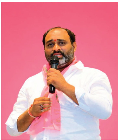
నిందితుడిని అరెస్ట్ చేయకపోవడం దారుణమని మండిపడ్డారు. పోక్సో చట్టం ప్రకారం ఫిర్యాదు అందిన వెంటనే కేసు

నమోదు చేసి నిందితుడిని అరెస్ట్ చేసి మెజిస్ట్రేట్ ముందు హాజరుపరచాల్సి ఉండగా పోలీసులు కావాలనే ఆలస్యం చేస్తున్నారని ఆరోపించారు. బాధితురాలి కుటుంబ సభ్యులు ఫిర్యాదు ఇవ్వడానికి పోలీస్ స్టేషన్ కు వెళ్లినప్పటికీ గంటల తరబడి వేచి ఉంచి కేసులం ఆన్-లైన్ వెబ్ సైట్ లో ఇచ్చి పంపించడం పోలీసుల వైఖరిని నిరసనగా వ్యక్తం చేశారు. గతంలో ఇతర ఘటనల్లో కఠిన చర్యలు కోరిన బండి సంజయ్ కుమార్ ఇప్పుడు తన కుమారుడి విషయంలో మాత్రం మౌనం వహించడం దుర్మతిగా భావించి నిరసనను తెలియజేస్తూ ప్రజాస్వామ్య బద్ధంగా కోసనాగిస్తుందని స్పష్టం చేశారు.