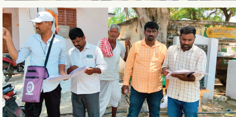
వెల్లూరు మే 11, (సిరిన్యాస్)