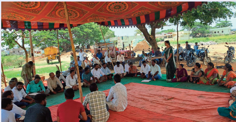
గుమ్మడిదల, మే 12 (సిరి న్యూస్):

నల్లవల్లి గ్రామసభలో రైతులు, గ్రామస్థుల ఏకగ్రీవ తీర్మానం