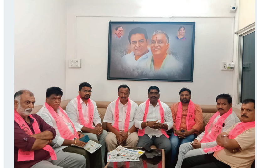
మెదక్ ప్రతినధి, మే 12 (సిరి న్యూస్)