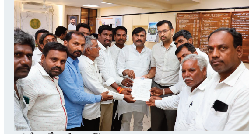
గుమ్మడిదల, మే 12 (సిరి న్యూస్):

జిల్లా కలెక్టర్ కు ఎమ్మెల్సీ అంజిరెడ్డితో కలిసి రైతుల వినతి