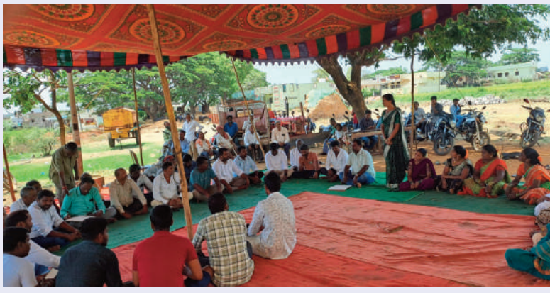
గుమ్మడిదల, మే 12 (సిరి న్యూస్):

నల్లవల్లి గ్రామసభలో రైతులు, గ్రామస్థుల ఏకగ్రీవ తీర్మానం