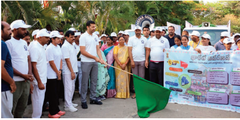
గుర్తు చేస్తూ దేశ పురోభివృద్ధిలో ప్రతి కుటుంబం భాగస్వామ్యం కావాలని ఆయన విజ్ఞాపించారు. ఈ కార్యక్రమంలో అడిషనల్ కలెక్టర్లు సంగీత, పాండు, అడిషనల్ ఎస్పీ చైతన్య రెడ్డి, వివిధ శాఖల అధికారులు, తహసీల్దార్లు, ఎన్యూమరేటర్లు, ఆసా వర్కర్లు మరియు పెద్ద సంఖ్యలో విద్యార్థులు, యువత పాల్గొన్నారు. తెలంగాణ సాంస్కృతిక సారథి కళాకారుల ప్రదర్శనలు విశేషంగా ఆకట్టుకున్నాయి.

ఈ సందర్భంగా కలెక్టర్ మాట్లాడుతూ.. జిల్లాలో మే 10వ తేదీ వరకు స్వీయ గణన ప్రక్రియ విజయవంతంగా ముగిసినందుకు, మే 11 నుండి ఎన్యూమరేటర్ల ద్వారా ఇంటింటి గణన ప్రక్రియ ప్రారంభమైందని తెలిపారు. ప్రత్యేక గుర్తింపు కార్డులు కలిగిన సిబ్బంది మీ ఇంటికి వచ్చినప్పుడు, వారికి కుటుంబ సభ్యులందరి సామాజిక, ఆర్థిక వివరాలను స్పష్టంగా అందించాలని, ప్రజలు ఇచ్చే సమాచారం పూర్తిగా గోప్యంగా ఉంటుందని, ఎవరూ భయపడాల్సిన అవసరం లేదని స్పష్టం చేశారు. ఈ గణాంకాల ఆధారంగానే ప్రభుత్వం భవిష్యత్తులో సంక్షేమ పథకాలను రూపొందిస్తుందని, అర్హులైన ప్రతి ఒక్కరికీ లబ్ధి చేకూరాలంటే ఖచ్చితమైన వివరాలు అందజేయడం పౌరుల కనీస బాధ్యతని