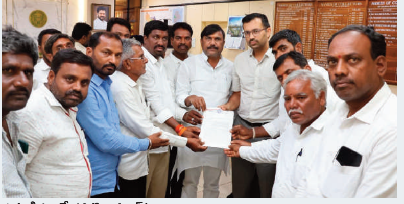
గుమ్మడిదల, మే 12 (సిరి న్యూస్):

జిల్లా కలెక్టర్ కు ఎమ్మెల్యే అంజిరెడ్డితో కలిసి రైతుల వినతి