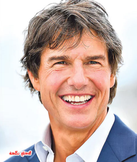
దీనిపై టామ్ నుంచి సూత్రప్రాయంగా అంగీకారం లభించినట్లు వార్తలు వినిపిస్తున్నాయి.

విజయవంతమైన 'మిషన్ ఇంపాజిబుల్' చిత్రాలతో ప్రపంచవ్యాప్తంగా గుర్తింపు పొందారు హాలీవుడ్ కథానాయకుడు టామ్ క్రూజ్. ప్రస్తుతం ఆయన 'డిగ్గర్' అనే సినిమాతో అల రించేందుకు సిద్ధమవుతున్నారు. ప్రస్తుతం నిర్మాణానంతర పనుల్లో ఉన్న ఈ హాలీవుడ్ చిత్రం ఆక్టోబరు 2న ప్రపంచవ్యాప్తంగా ప్రేక్షకుల ముందుకు రానుంది. అయితే ఈలోగానే తన తదుపరి సినిమాకి సంబంధించి ఆసక్తికర వార్త బయటకొచ్చింది. ఇప్పుడాయన పారామౌంట్ పిక్చర్స్ సంస్థలో 'డూపెల్ గాంగర్' అనే స్పై థ్రిల్లర్ చిత్రం చేసేందుకు సిద్ధమవుతున్నట్లు తెలిసింది. దీన్ని తెలుగు మూలాలన్న యువ దర్శకుడు అనీష్ చాగంటి తెరకెక్కించే అవకాశముందని హాలీవుడ్ మీడియాలో వార్తలు వినిపిస్తున్నాయి. 2018లో వచ్చిన 'సెర్పెంట్' అనే చిత్రంతో ప్రపంచవ్యాప్తంగా గుర్తింపు తెచ్చుకున్న అనీష్, ఆయన.. దాన్ ఫ్రే కలిసి రాసిన 'డూపెల్ గాంగర్' స్క్రిప్ట్ పారామౌంట్ సంస్థ కొనుగోలు చేసినట్లు తెలిసింది. ఇప్పుడా స్పై థ్రిల్లర్ కథతోనే టామ్ క్రూజ్ ని అనీష్ సంప్రదించినట్లు తెలిసింది. ఇప్పటికే ఈ ప్రాజెక్ట్ విషయమై షీల్డ్ చేసిన పలుమార్లు చర్చలు జరిగినట్లు సమాచారం.