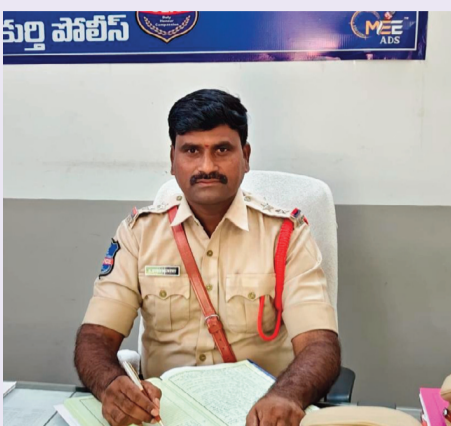
కల్వకుర్తి, మే (సిరి న్యూస్):