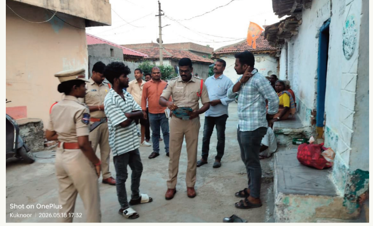
వెల్తుల్లి, మే 18 : (సిరిస్యూస్):

వెల్తుల్లి మండలంలోని కుకునూరు గ్రామానికి చెందిన ఓ మహిళపై లైంగిక దాడి జరిగినట్లు ఆలస్యంగా వెలుగులోకి వచ్చింది. బాధితురాలు ఇచ్చిన ఫిర్యాదు మేరకు స్థానిక పోలీస్ స్టేషన్ లో కేసు నమోదు చేశారు. బాధితురాలి ఫిర్యాదు ప్రకారం బాధితురాలు తన కుమారుడుతో కలిసి గ్రామానికి చెందిన ఓ వ్యక్తి ఇంట్లో అడ్డకుంటుంది. ఈనెల 17న మధ్యాహ్నం సమయంలో ఇంటి యజమాని తన బదుగురు స్నేహితులతో కలిసి ఇంటికి వచ్చి కోడి మాంసం వండించుకొని మద్యం సేవించినట్లు తెలిపింది. అనంతరం తాను మత్తులో స్వూహ కోల్పోయినట్లు పేర్కొంది. సాయంత్రం సమయంలో తన కుమారుడు ఇంటికి వచ్చి నిద్రలేచగా, తన దుస్తులు సరిగా లేకుండా ఉండటాన్ని గమనించినట్లు తెలిపింది. తాను స్వూహలో లేని సమయంలో సదరు వ్యక్తి అతని స్నేహితులు తనపై లైంగిక దాడి చేయడానికి ప్రయత్నించి ఉండొచ్చని బాధితురాలు అనుమానం వ్యక్తం చేసింది. ఈ మేరకు ఫిర్యాదు స్వీకరించిన పోలీసులు కేసు నమోదు చేసి దర్యాప్తు చేపట్టారు.