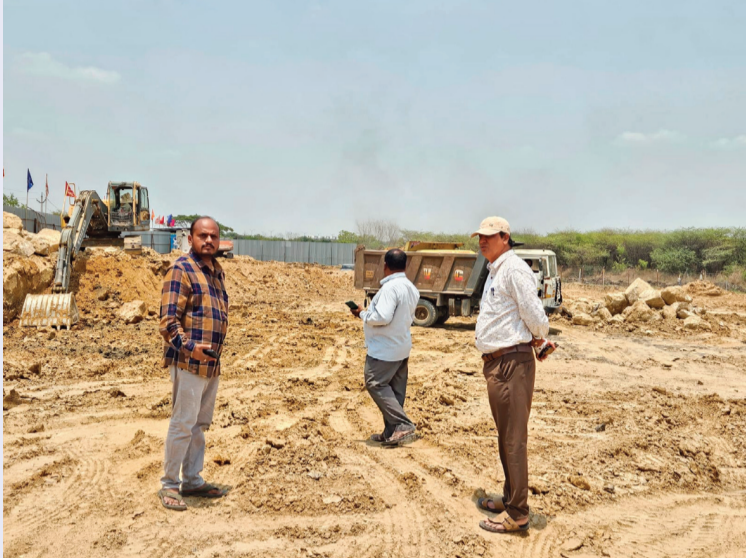
ఆమీన్ ఫూర్ మే 18 సిరి న్యూస్

బదు టిప్పర్లు రెండు హిటాచీలకు జరిమానా డే అండ్ నైట్ టిప్పర్ల ఇష్ట రాజ్యం ట్రేక్ వేసిన తహసిల్దార్ ప్రైవేటు వెంచర్ల ఇష్టారాజ్యం నిబంధనలు ఉల్లంఘిస్తే సహించేది లేదు ఫీల్డ్ లోకి ఎంబర్ అయిన తహసిల్దార్ సర్వేయర్... సరిహద్దులు భూములపై విస్తృత తనిఖీలు