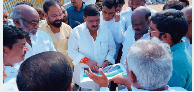
రామచంద్రపురం, (పటాన్ చెరు), మే 18, (సిరి న్యూస్):

రూ.7.60 కోట్లతో అభివృద్ధి పనులు త్వరలో ప్రజలకు అందుబాటులోకి: ఎమ్మెల్యే జిఎంఆర్