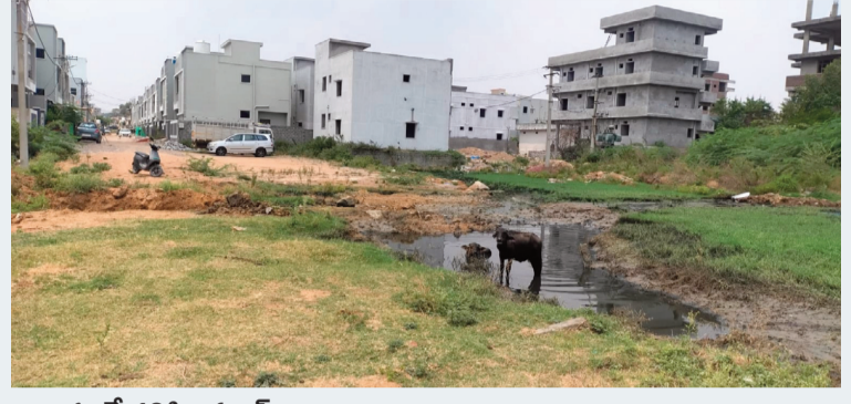
జనారం మే 18 సిరి న్యూస్

పేరుకే విల్లాలు పక్కనే పెడితే డ్రైనేజీ రూల్స్ బయటకు వెదజల్లుతున్న సాయి కౌంటీ విల్లాస్ సాయి కౌంటీ మురుగునీటి స్థానికులకు నరకప్రాయం