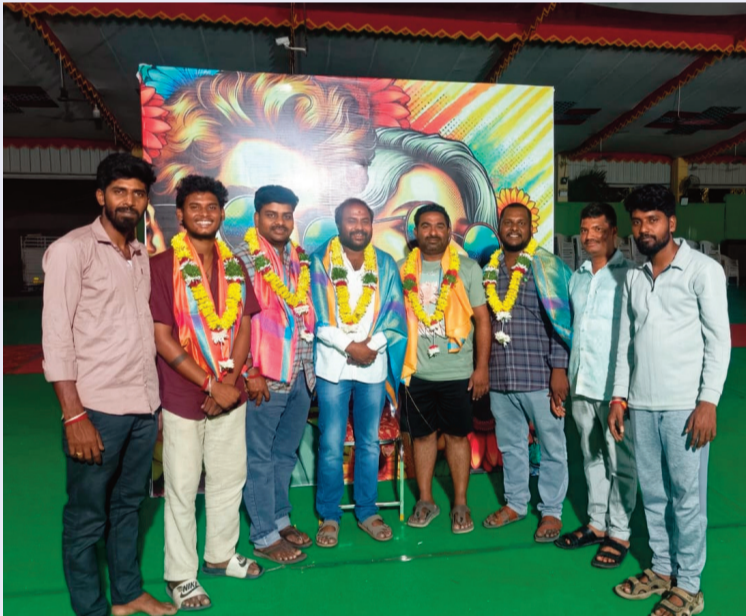
రామాయంపేట, మే 18 (సిరి న్యూస్)