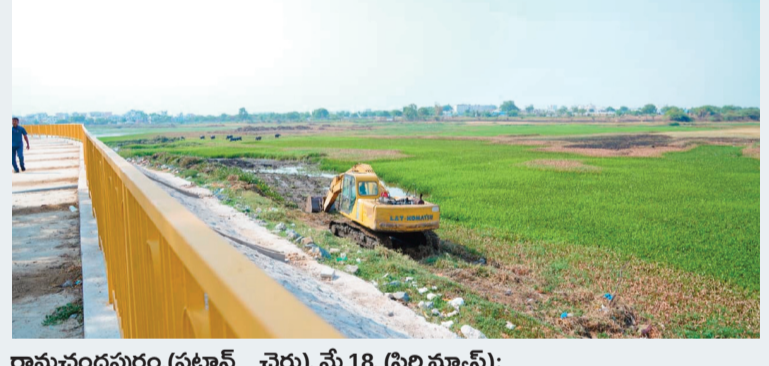
రామచంద్రపురం, (పటాన్ చెరు), మే 18, (సిరి న్యూస్):