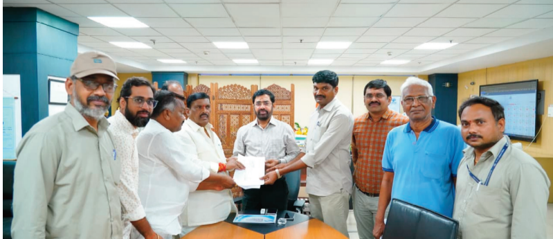
రామచంద్రపురం, మే 18, (సిరి న్యూస్):