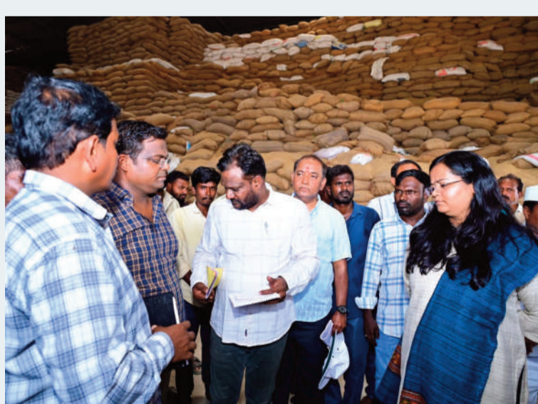
శివంపేట మే 25 (సిరి న్యూస్)