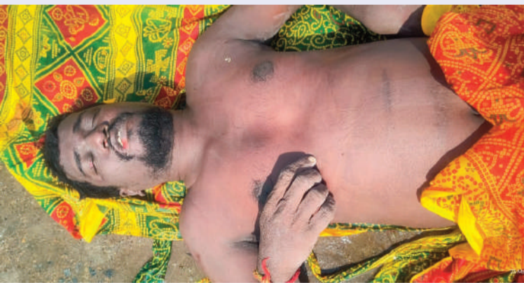
పాపన్నపేట మే 25