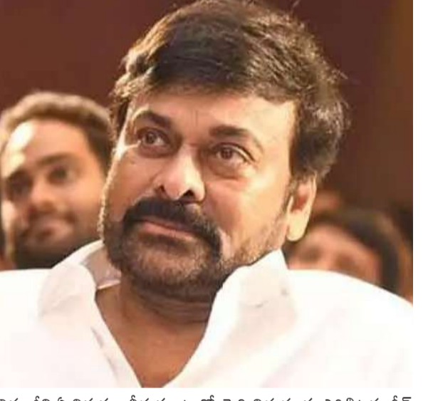
చిరంజీవి ఏ నిర్ణయం తీసుకుంటారో, పెద్ది విడుదలకు ఎగ్జిబిటర్లు గ్రీన్ సిగ్నల్ ఇస్తారో లేదో చూడాలి.

రామ్ చరణ్ హీరోగా.. బుచ్చిబాబు సానా దర్శకత్వంలో భారీ బడ్జెట్ తెరకెక్కించిన పెద్ది సినిమా మరో 10 రోజుల్లో విడుదలకు సిద్ధమైంది. ఇప్పటికే సినిమా ప్రమోషన్లను చిత్రబృందం వేగవంతం చేయగా.. ఈ సినిమాపై భారీ అంచనాలే ఉన్నాయి. అయితే తెలంగాణ సినిమా విడుదలపై నంది గ్రత వెలకొంది. ఇకపై సినిమాల విడుదలలో తమకు పర్మిట్ జిని ఇవ్వాలని ఎగ్జిబిటర్లు డిమాండ్ చేస్తున్న విషయం తెలిసింది. అయితే.. పెద్ది సినిమా నుంచే దానిని అమలు చేయాలని ఎగ్జిబిటర్లు కోరుతున్నారు. ఈ సినిమా తర్వాత పెద్ది సినిమా లేవని, పెద్ది నుంచి పర్మిట్ జిని విధానాన్ని అమలు చేస్తే.. తాము కూడా సప్లయ్ కుండా ఉంటామని ఎగ్జిబిటర్లు చెబుతున్నారు. పర్మిట్ జిని ఇవ్వకుంటే పెద్ది సినిమా విడుదల కానివ్వమని ఇటీవలే ఎగ్జిబిటర్లు తేల్చి చెప్పిన విషయం తెలిసిందే. తాజాగా ఈ విషయంపై చర్చించేందుకు మెగాస్టార్ చిరంజీవితో తెలంగాణ ఎగ్జిబిటర్ల బృందం సమావేశమయింది. పర్మిట్ జిని విధానం లోనే పెద్ది సినిమాను విడుదల చేయాలని చిరంజీవితో చర్చిస్తున్నారు. అలాగే సింగిల్ స్ట్రీమ్ థియేటర్లు, రెంటల్ విధానంలో తాము చూస్తున్న సప్లయ్ ను గురించి కూడా అసోసియేషన్ చిరంజీవితో వివరించనుంది. ఈ సమావేశానికి ఫిలిం చాంబర్ అధ్యక్షుడు సురేష్ బాబు, కేవల్ నారాయణ, నిర్మాత దిల్ రాజు హాజరయ్యారు. సమావేశం తర్వాత