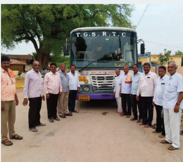
కొల్లూరం, మే 25, (జనం సాక్షి):