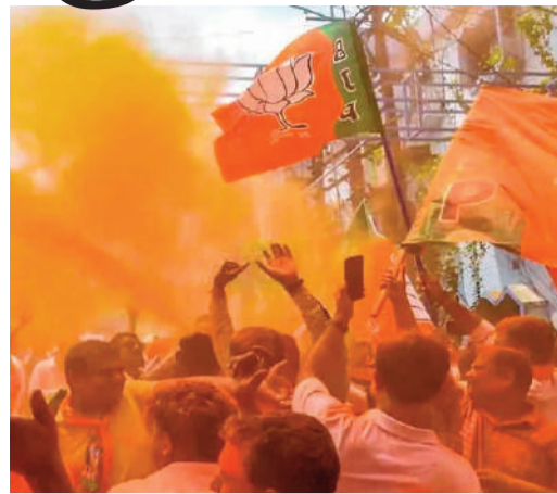
చెబుతుంది. మరోవైపు ఈ ప్రమాణ స్వీకార కార్యక్రమం ఏర్పాట్లపై ప్రభుత్వ ఉన్నతాధికారులు ఇప్పటికే దృష్టి కేంద్రీకరించారు.

సమీక్ భట్టాచార్య బుధవారం కోల్కతాలో ప్రకటించారు. ఉదయం 10 గంటలకు మహానగరంలోని ప్రతిష్టాత్మక ట్రిగ్గేడ్ పరేడ్ గ్రౌండ్స్ లో ఈ కార్యక్రమం జరుగుతుందని వివరించారు. గురువారం సాయంత్రం కోల్కతాలో శాసనసభా పక్ష సమావేశం జరుగుతుందని సమీక్ భట్టాచార్య తెలిపారు. ఈ సమావేశంలో శాసనసభా పక్ష నేతను పార్టీ ఎమ్మెల్యేలు అంతా కలిసి ఎన్నుకుంటారని చెప్పారు. ముఖ్యమంత్రి ప్రమాణ స్వీకార కార్యక్రమానికి ప్రధాని నరేంద్ర మోదీ, పలువురు కేంద్ర మంత్రులు, బీజేపీ పాలిత రాష్ట్రాల ముఖ్యమంత్రులు, ఎన్డీయే నాయకులు హాజరవుతారని అంచనా వేస్తున్నారు. కార్యక్రమానికి పార్టీ సీనియర్ నేతలతోపాటు కార్యకర్తలు పెద్ద ఎత్తున హాజరవుతారని పార్టీ నేతలు చెబుతున్నారు. పశ్చిమ బెంగాల్ లో కొత్తగా కొలువుదీరనున్న మంత్రి వర్గంలో దాదాపు 24 మంది మంత్రులుగా ప్రమాణ స్వీకారం చేసే అవకాశాలు ఉన్నాయని రాష్ట్ర నాయకత్వం