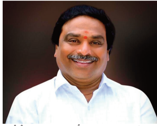
సదాశివపేట, మే 28, సిరి న్యూస్: