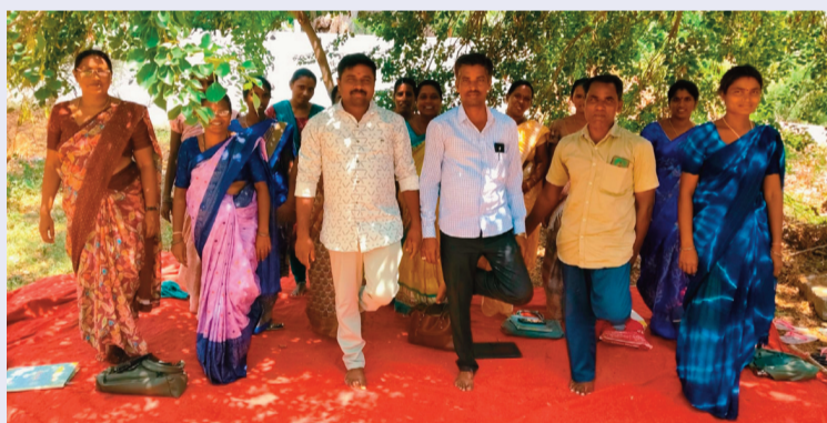
వెల్దురి మే 28, (సిరి న్యూస్):

ఐకెపి సంఘాల్లో విధులు నిర్వహిస్తున్న వీ ఏవోల సమస్యలను పరిష్కరించాలని డిమాండ్ చేస్తూ డిమాండ్లను పరిష్కరించాలని కోరుతూ ఆ సంఘం ఆధ్వర్యంలో చేస్తున్న సమ్మె 11 రోజుకు చేరుకుంది. వెల్దురి మండలంలోని ఐకెపి కార్యాలయం ముందు ఒంటికాళ్లతో నిరసన తెలుపుతున్నారు. మండల కేంద్రంలో నిర్వహించి సమ్మెకు స్థానిక నాయకులు సంఘీభావం తెలుపుతున్నారు. ప్రభుత్వం వెంటనే వివో ఏ డిమాండ్లను పరిష్కరించాలని కోరారు. ఈ సందర్భంగా వివో ఏలు మాట్లాడుతూ సమస్యలు పరిష్కరించకపోతే రాబోయే రోజులలో సమ్మెను ఉద్యతం చేస్తామని వారు తెలిపారు.