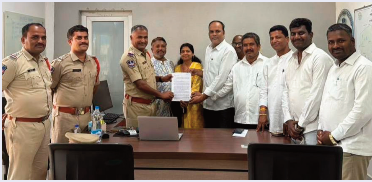
రామచంద్రపురం (పటాన్ చెరు), మే 28 (సిరి న్యూస్):