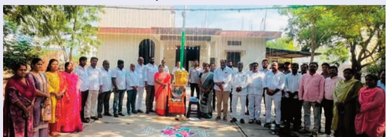
రామచంద్రపురం, జాన్ 2 (సిరి న్యూస్):