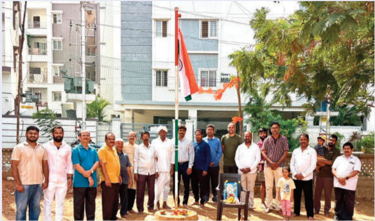
అమీన్ పూర్ జాన్ 2 సిరి న్యూస్