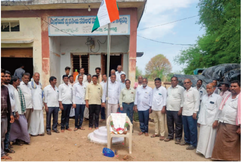
గుమ్మడిదల, జూన్ 2(సిరి స్టూన్స్):

కావాలని పిలుపునిచ్చారు. రైతుల సంక్షేమం, వ్యవసాయాభివృద్ధి ప్రభుత్వ ప్రధాన లక్ష్యమని పేర్కొన్నారు. ఈ సందర్భంగా తెలంగాణ ఉద్యమ అమరవీరులను స్మరించుకుని వారికి ఘన నివాళులు అర్పించారు. రాష్ట్రం ఏర్పడిన తరువాత అన్ని రంగాల్లో గణనీయమైన అభివృద్ధి సాధించినదన్నారు. కార్యక్రమంలో పీపీఎస్, పంచాయతీ పాలకవర్గ సభ్యులు, రైతులు, సిబ్బంది, గ్రామ ప్రజలు పాల్గొన్నారు. వేడుకలు ఉత్సాహభరితంగా సాగగా, పాల్గొన్న వారందరికీ మిఠాయిలు పంపిణీ చేశారు. తెలంగాణ ఆవిర్భావ దినోత్సవ శుభాకాంక్షలు తెలియజేస్తూ కార్యక్రమాన్ని ముగించారు.