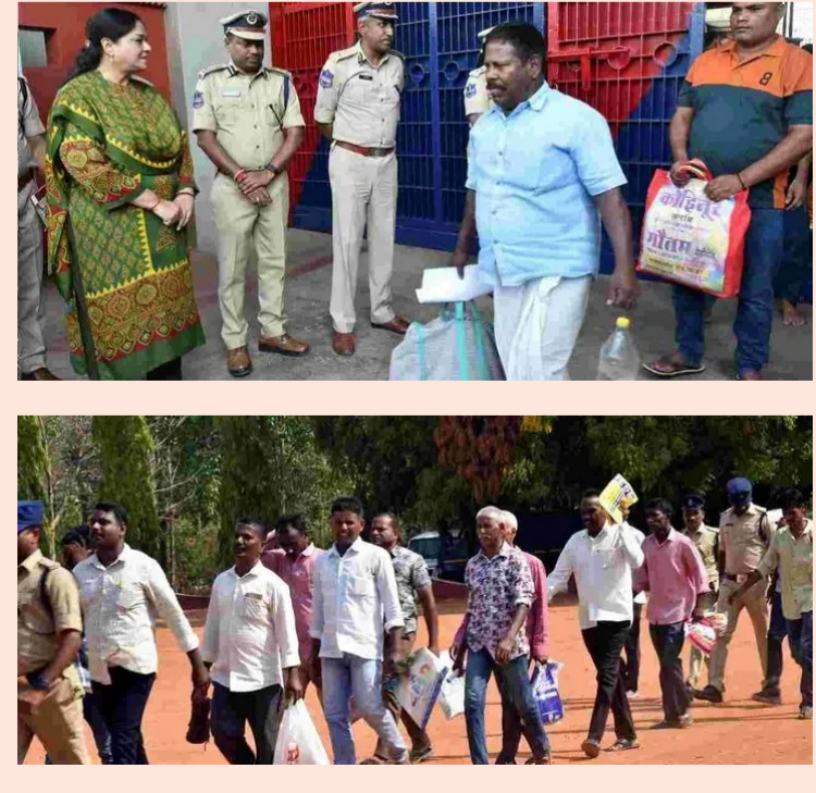
జైళ్ల శాఖ అధ్యక్షులతో నిర్వహిస్తున్న పెట్రోల్ బంకుల్లో పనిచేయడానికి ఆసక్తి చూపినట్లు డిజి తెలిపారు.

చుకున్నారు, వారికి కూడా అవసరమైన సహకారం అందిస్తామని వెల్లడించారు. విడుదల అవుతున్న మహిళా ఖైదీల్లో నలుగురికి కుట్టు మిషన్లు అందజేసి ఉపాధి అవకాశాలు కల్పించనున్నట్లు తెలిపారు. విడుదల పొందిన వారు బాధ్యతాయుతంగా జీవించి సమాజంలో మంచి గుర్తింపు తెచ్చుకుంటే.. జైళ్ల శాఖ చేసిన కృషి ఫలితం ప్రభుత్వం, అధ్యక్షుల ఖైదీలకు విదాదిలో మూడు సార్లు క్షమాభిక్ష ఆధారంగా విడుదల అవకాశాలు కల్పించే విధానాన్ని అమలు చేస్తోందని వెల్లడించారు.