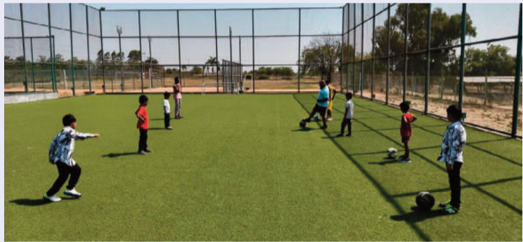
రామచంద్రపురం, (పటానెరు), జాన్ 2 (సిరి న్యూస్):

గీతంలో వేసవి క్రీడా శిబిరానికి విశేష స్పందన ఆరోగ్యకర జీవనశైలికి ప్రోత్సాహం