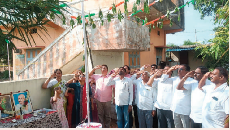
వెల్పల్లి, జూన్ 02 (సిరి న్యూస్):

తెలంగాణ ఆవిర్భావ దినోత్సవ వేడుకలను మంగళవారం వెల్పల్లి మండలంలో ఘనంగా నిర్వహించారు. గ్రామ గ్రామాన వేడుకలు జరిగాయి. మండలంలోని అన్ని గ్రామ పంచాయతీల కార్యాలయాల ఎదుట సర్పంచులు జాతీయ జెండాను ఎగురవేసి తెలంగాణ గేయాన్ని ఆలపించారు. ప్రభుత్వ కార్యాలయాల ఎదుట అధికారులు ఘనంగా వేడుకలను నిర్వహించారు. వివిధ ప్రభుత్వ శాఖలకు చెందిన అధికారులు సిబ్బంది పాల్గొన్నారు. కాంగ్రెస్, బీఆర్ఎస్, పార్టీల నాయకులు తెలంగాణ ఆవిర్భావ దినోత్సవ వేడుకలలో పాల్గొని తెలంగాణ ప్రాముఖ్యత విశిష్టతను వివరించారు. ఆయా పార్టీ కార్యాలయాల ఎదుట జెండాలను ఎగర వేశారు.