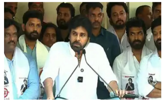
మగతా 2వ పేజీలో..

హైదరాబాద్, జూన్ 2: తెలంగాణలో ప్రజల సమస్యలపై స్పందించడం జనసేన పార్టీ బాధ్యత అని ఆ పార్టీ అధినేత, ఆంధ్రప్రదేశ్ ఉప ముఖ్యమంత్రి పవన్ కల్యాణ్ పేర్కొన్నారు. తెలంగాణ ఎవరి వ్యక్తిగత ఆస్తి కాదని, ప్రజా సమస్యలపై మాట్లాడే హక్కు ప్రతి రాజకీయ పార్టీకి