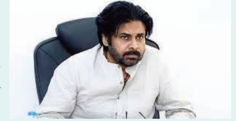
సేంద్రుకే పవన్ ప్రయత్నిస్తున్నారు" అని కాంగ్రెస్ ప్రత్యారోపణలు చేస్తోంది.

ప్రాంతీయ సెంటిమెంట్ సెగ పవన్ కళ్యాణ్ ఇటీవల కోసినీమ పర్యటనలో చేసిన కొన్ని వ్యాఖ్యలు— "తెలంగాణ నాయకులు కోసినీమ పచ్చదనాన్ని చూసి దిష్టి పెట్టారు" అనే ఆర్డల్లో సాగిన ప్రకటన. ఈ వివాదానికి ప్రధాన కారణమైంది. దీనికి తోడు ప్రముఖ విశ్లేషకులతో జరిగిన అంతర్గత పరోక్ష యుద్ధం, జర్నలిస్టుల నిరసనలు వాతావరణాన్ని మరింత వేడెక్కించాయి. పవన్ వ్యాఖ్యలు తెలంగాణ ఆత్మగౌరవాన్ని కించపరిచేలా ఉన్నాయని అధికార కాంగ్రెస్, ఇతర ప్రాంతీయ శక్తులు తీవ్రంగా మండిపడ్డాయి. తెలంగాణ ప్రజలకు క్రమాపథం చెప్పిన తర్వాతే పవన్ ఇక్కడ సభ పెట్టుకోవాలని రాష్ట్ర మంత్రులు డిమాండ్ చేయడం, గన్ పార్క్ వద్ద ఇరు పార్టీల కార్యకర్తలు ఘర్షణకు దిగడం చూస్తే ప్రాంతీయ సెంటిమెంట్లు ఎంత త్వరగా రాజుకుంటాయో మరోసారి రుజువైంది. గచ్చిబౌలి పరిధిలో ట్రాఫిక్ పార్కింగ్ సమస్యలతో పాటు శాంతిభద్రతల ముప్పు ఉందంటూ సైబరాబాద్ ఆంధ్రప్రదేశ్ లో కూటమి ప్రభుత్వ విజయకే తనలో కీలక పాత్ర పోషించిన అనంతరం ఆయన దృష్టి ఇప్పుడు సహజంగానే తెలంగాణ వైపు మళ్లించింది. తెలంగాణ ఆవిర్భావ దినోత్సవం సాక్షిగా హైదరాబాద్ లో సభ పెట్టి పార్టీ కేంద్రంలో జోష్ నింపాలని ఆయన భావించినప్పటికీ, అది కాస్తా తీవ్ర రాజకీయ ఉద్రిక్తతలకు, వివాదాలకు దారితీయడం తెలుగు రాజకీయాల సంక్లిష్టతను ప్రతిబింబిస్తోంది.