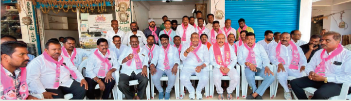
గుమ్మడిదల, జూన్ 3 (సిరి న్యూస్):