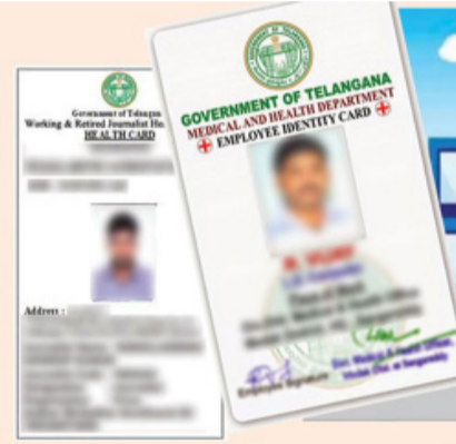
EJHS: Employee and Journalist Health Scheme by Govt. of Telangana

తెలంగాణ బ్యూరో, సిరి న్యూస్: తెలంగాణ ప్రభుత్వం ప్రతిష్టాత్మకంగా ప్రకటించిన ప్రభుత్వ ఉద్యోగుల ఆరోగ్య భద్రత ట్రస్ట్ ప్రారంభానికి ముందే తీవ్ర విమర్శల పాలవుతోంది. జూన్ 1వ తేదీ నుంచే ఉద్యోగులకు ఎలాంటి ఆరోగ్య సమస్యలు వచ్చినా కార్పొరేట్ అస్పత్రుల్లో నగదు రహిత సేవలు అందించడానికి ఈ ట్రస్ట్ను ఏర్పాటు చేస్తున్నామని సాక్షాత్తు ముఖ్యమంత్రి ప్రకటించారు. ఇందుకోసం ఉద్యోగుల మూలవేతనంలో 1.5 శాతం వాటా కట్ చేయడానికి, దానికి సమానంగా ప్రభుత్వం కూడా మరో 1.5 శాతం నిధులు ఇచ్చేందుకు అంగీకరించింది. ఈ విధానం ద్వారా ఉద్యోగులందరికీ మెరుగైన ఆరోగ్య సేవలు అందించాలన్నది ప్రభుత్వ మంచి సంకల్పమే అయినప్పటికీ.. అధికారుల అతివల్ల ఈ పథకానికి అదిలోనే గం దీపడింది. ప్రకటన రాగానే మార్గదర్శకాలు విడుదల చేసి, ట్రస్ట్ బోర్డును ఏర్పాటు చేయాలని అధికారులు.. అసలు ట్రస్ట్ ఉనికిలోకి రాకముందే ఉద్యోగుల మే నెల జీతాల నుండి రికవరీ మొదలుపెట్టారు. ఇలా రాష్ట్రవ్యాప్తంగా దాదాపు 10 లక్షల మంది ఉద్యోగులు, పెన్షన్ యనేది ఉద్యోగుల