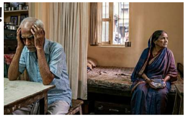
తెలంగాణ బ్యూరో, సిరి న్యూస్:

తెలంగాణ వచ్చాక వాళ్లకు మొదటి తేదీనే జీతం మరి ఇప్పుడు అందరికీ వాళ్లకెందుకు ఆపినట్లు? రైతు డిస్కం వద్దనడమే సార్ కోపం తెప్పించింది! సంస్థ బాగుకోనే వాస్తవాలు చెప్పడమే వాళ్ల తప్పిదమా? రేవంత్ సర్కారు మాట విద్యుత్ శాఖకు వర్తించదా? కనీసం భర్తలకు లేక వృద్ధాప్యంలో తప్పని తిప్పలు ప్రభాకర్ రావు నిర్ణయాల్లో పెన్షన్ భారానికి కారణమా యాజమాన్యాల తీరుపై ఉద్యోగ సంఘాల తీవ్ర మండిపాటు మొదటిసారిగా వృద్ధులకు చెల్లించాల్సిన పెన్షన్ నిలిపివేత మిగతా ఉద్యోగులందరికీ జీతాలు ఇచ్చి వృద్ధులకే అన్యాయం వెంటనే పెన్షన్ విడుదల చేయాలని డిమాండ్.