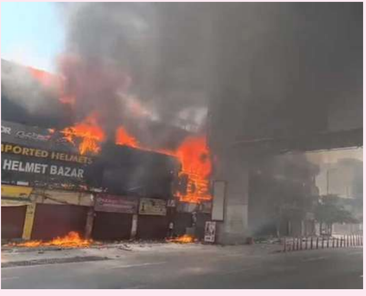
అమీర్ పేట్ లో భారీ అగ్ని ప్రమాదం

ప్రమాద తీవ్రతను దృష్టిలో ఉంచుకుని పోలీసులు కూడా సహాయక చర్యల్లో పాల్గొన్నారు. అగ్నిప్రమాదం కారణంగా ఆ ప్రాంతంలో కొంతసేపు ట్రాఫిక్ రద్దీ నెలకొంది. భద్రతా చర్యల్లో భాగంగా ప్రజలను సురక్షిత ప్రాంతాలకు తరలించారు. ఈ ప్రమాదంలో ఎవరైనా గాయపడ్డారా, ప్రాణనష్టం జరిగిందా అనే విషయాలపై ఇంకా స్పష్టత రాలేదు. అగ్నిప్రమాదానికి గల కారణాలు తెలియాల్సి ఉంది. మంటలు పూర్తిగా అదుపులోకి వచ్చిన తర్వాత ప్రమాదానికి దారితీసిన కారణాలపై అధికారులు దర్యాప్తు చేపట్టనున్నారు.