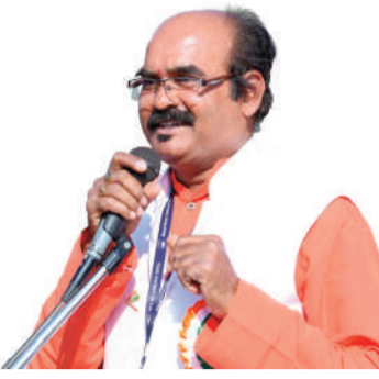
రామచంద్రపురం, జూన్ 5 (సిరి న్యూస్) :

ప్రకృతి పరిరక్షణ ద్వారానే మానవాళి మనుగడ సాధ్యమవుతుందని, పెరుగుతున్న వాతావరణ వేడి, కాలుష్య ప్రభావాలను తగ్గించాలంటే ప్రతి ఒక్కరూ పర్యావరణ