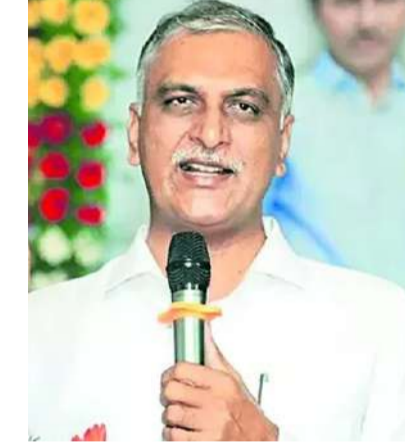
వెంటనే ప్రత్యేకంగా పీవీఎస్ డివిజన్ ఆఫీసును ఏర్పాటు చేయాలని డిమాండ్ చేశారు.

యనాలు స్పష్టం చేస్తున్నాయి. ముంపు వల్ల వచ్చే వడో నష్టపోతున్న సుమారు 2,000 కుటుంబాలకు తక్షణమే సప్లయ్ పరిహారం పాటు పూర్తి స్థాయి పునరావాసం కల్పించాలని హరిష్ రావు డిమాండ్ చేశారు. భద్రాచలం డ్రైనేజీ వ్యవస్థకు అనుసంధానంగా ఉన్న 8 అవుట్ పోర్ట్ రెగ్యులేటర్లు బ్యాక్ వాటర్ ముప్పును ఎదుర్కొంటున్నాయి, కాబట్టి వరద నీటిని గోదావరిలోకి పంపేందుకు తక్షణమే పంపింగ్ స్టేషన్లు, ట్రిబ్యుల్ ఫ్లాంట్లు నిర్మించాలని కోరారు. భద్రాచలం వద్ద కొత్తగా 5 కిలోమీటర్ల మేర కరకట్టల నిర్మాణం చేపట్టడంతో పాటు, బూర్గంపాడు, సారపాక తదితర ముంపు గ్రామాలకు రక్షణ గోడలు నిర్మించి పరిహారం అందించాలని కోరారు. తెలంగాణలో పోలవరం ముంపు సమస్యల పరిష్కారం, పునరావాస పనుల పర్యవేక్షణ కోసం భద్రాచలంలో