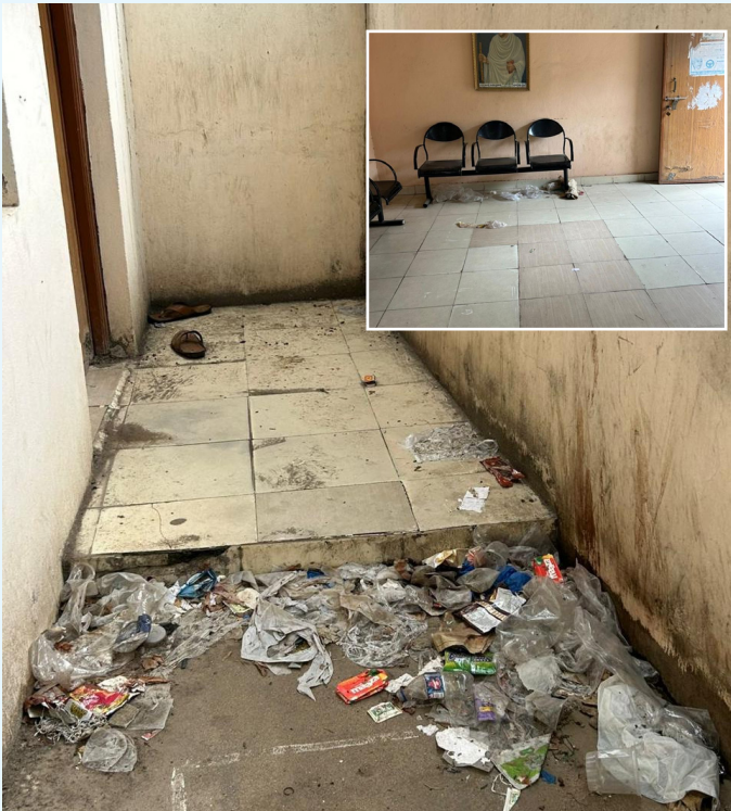
రామచంద్రపురం (పటాన్-చెరు), జూన్ 24 (సిరి న్యూస్):

ప్రజలకు సేవలు అందించాల్సిన విద్యుత్ శాఖ బిల్లుల వసూళ్ల విషయంలో చురుగ్గా వ్యవహరిస్తున్నప్పటికీ, కార్యాలయ నిర్వహణ విషయంలో మాత్రం తీవ్ర నిర్లక్ష్యం ప్రదర్శిస్తోందనే విమర్శలు వ్యక్తమవుతున్నాయి. పటాన్-చెరు పట్టణంలోని విద్యుత్ బిల్లు కలెక్షన్ కార్యాలయం ప్రస్తుతం చెత్తకుప్పను తలపిస్తోంది. కార్యాలయం చుట్టూ పక్కలతో పాటు లోపల కూడా ఎక్కడ చూసినా చెత్త చెదారం కనిపిస్తుండగా, అపరిశుభ్ర వాతావరణం నెలకొంది. పేరుకుపోయిన వ్యర్థాల నుంచి దుర్గంధం వెదజల్లుతుండటంతో వినియోగదారులు ముక్కు మూసుకుని బిల్లులు చెల్లించాల్సిన పరిస్థితి ఏర్పడిందని ఆవేదన వ్యక్తం చేస్తున్నారు. గోడలపై తేమ, మురికి మరకలు పేరుకుపోవడంతో కార్యాలయ నిర్వహణపై ప్రజలు అసంతృప్తి వ్యక్తం చేస్తున్నారు. ప్రతిరోజూ పెద్ద సంఖ్యలో వినియోగదారులు బిల్లులు చెల్లించేందుకు కార్యాలయానికి వస్తున్నప్పటికీ, కనిన పారిశుధ్య చర్యలు చేపట్టడంలో అధికారులు విఫలమయ్యారనే విమర్శలు వినిపిస్తున్నాయి. వసూళ్లపై చూపుతున్న శ్రద్ధను కార్యాలయ పరిశుభ్రత, నిర్వహణపై ఎందుకు చూపడం లేదని స్థానికులు ప్రశ్నిస్తున్నారు. ఈ సమస్యను పలుమార్లు సంబంధిత అధికారుల దృష్టికి తీసుకెళ్లినా స్పందన కరువైందని వినియోగదారులు వాపోతున్నారు. స్వచ్ఛ భారత్ వంటి కార్యక్రమాలను ప్రచారం చేసే ప్రభుత్వ శాఖలే తమ కార్యాలయాల పరిశుభ్రతను విస్మరిస్తే ఎలా అని ప్రజలు ప్రశ్నిస్తున్నారు. ఇప్పటికైనా ఉన్నతాధికారులు స్పందించి కార్యాలయ పరిసరాలను శుభ్రపరచడంతో పాటు, ప్రజలకు పరిశుభ్రమైన వాతావరణంలో సేవలు అందేలా తగిన చర్యలు చేపట్టాలని స్థానికులు కోరుతున్నారు. “విద్యుత్ బిల్లులు మాత్రం సకాలంలో వసూలు చేస్తున్న అధికారులు... కార్యాలయాన్ని శుభ్రంగా ఉంచే బాధ్యత లేదా?” అనే ప్రశ్న ఇప్పుడు వినియోగదారుల నుంచి వినిపిస్తోంది.