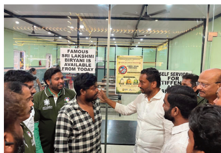
సమయాన్ని కేటాయిస్తూ పర్యావరణ పరిరక్షణ కార్యక్రమం