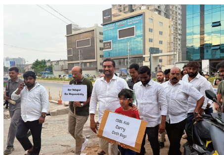
పరమైన బాధ్యతలతో పాటు సమాజ హితం కోసం