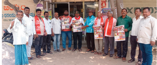
లోనికి వచ్చినంత పెట్రోల్ డీజిల్ ధరలు అమాంతం పెరిగిపోయిన నిత్యవసర వస్తువుల ధరలు రెండు రెట్లు ఎక్కువ పెరగడం వల్ల ప్రజలు తీవ్రమైన ఆర్థిక ఇబ్బందులకు గురవుతున్నారని, ధరలు పెరుగుతున్నాయి కానీ వారి ఆర్థిక పరిస్థితులు మాత్రం మారడం లేదని పేర్కొన్నారు. మోడీ మిత్రులైన ఆదాని, అంబానిల ఆర్థిక