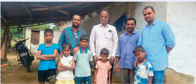
పాపనపేట జూన్ 8 (సిరి న్యూస్) :