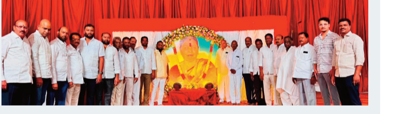
మేడ్చల్ మల్కాజ్గిరి జిల్లా ప్రతినిధి సిరి స్టూన్ జూన్ 8