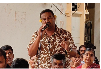
ఉద్ధిక్ వాతావరణం నెలకొంది.

రాష్ట్ర ప్రభుత్వం ప్రతిష్టాత్మకంగా నిర్వహిస్తున్న 99 రోజుల ప్రజా పాలన-ప్రగతి ప్రణాళిక లో భాగంగా సోమవారం నాడు మెదక్ జిల్లా రామాయంపేట పట్టణంలో నిర్వహించిన వార్డు సభలో కొద్దిసేపు కాంగ్రెస్ పార్టీ బీఆర్ఎస్ నాయకుల మధ్య వాగ్వాదం చోటు చేసుకుంది. వివరాలికి వెళ్తే.. రామాయంపేట మున్సిపాలిటీలో నిర్వహించిన వార్డు సభ కాంగ్రెస్, బీఆర్ఎస్ పార్టీల మధ్య తీవ్ర రాజకీయ చర్చకు దారితీసింది. గత ఎన్నికల ముందు కాంగ్రెస్ పార్టీ ప్రజలకు ఇచ్చిన ఆరు గ్యారంటీలు, ఇతర హామీలను నేటికే నెరవేర్చలేదని ఆరోపిస్తూ బీఆర్ఎస్ నాయకుడు, మాజీ ఎంపీటీసీ ఎస్సీ హైమమ్ వినుతా పూలు పెట్టుకుని సభకు హాజరై వినుతా రీతిలో తమ నిరసనను వ్యక్తం చేశారు. దీంతో ఇరు పార్టీల నాయకుల మధ్య తీవ్ర వాదోపవాదాలు చోటుచేసుకుని సభలో కొద్దిసేపు