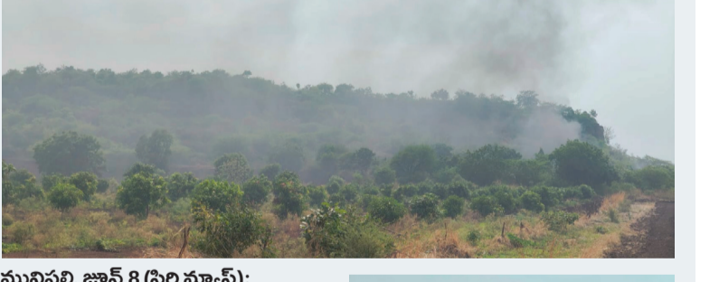
మునిపల్లి, జూన్ 8 (సిరి స్టూన్):

మునిపల్లి మండలంలోని కంకోల్, లింగంపల్లి శివారలో ఉన్న గుట్టల్లో చెత్తను అక్రమంగా దంప్ చేసి తగులబెడు తుండంతో భారీగా పొగలు వ్యాపిస్తున్నాయి. రోజుల తరబడి ఎగిసిన పురుగు మందులు, దుర్వాసనతో స్థానిక ప్రజలు, రైతులు తీవ్ర ఇబ్బందులు ఎదుర్కొంటున్నారు. గుట్టల్లో పేరుకుపోయిన చెత్తలో ప్లాస్టిక్, రసాయన వ్యర్థాలు ఉండటంతో వెలుపడుతున్న పొగ పర్యావరణానికి హానికరంగా మారినది రైతులు ఆందోళన వ్యక్తం చేస్తున్నారు. ఈ విషయంపై సంబంధిత పంచాయతీ కార్యదర్శులకు ఫిర్యాదు చేసినా ఎలాంటి చర్యలు తీసుకోలేదని ఆరోపిస్తున్నారు. జాతీయ రహదారి ఎన్హెచ్-65పై ప్రయాణించే వారికి సైతం ఈ పొగలు స్పష్టంగా కనిపిస్తున్నప్పటికీ అధికారులు నిర్లక్ష్యంగా వ్యవహరిస్తున్నారని గ్రామస్తులు మండిపడుతున్నారు. ఈ అంశంపై సంబంధిత పర్యావరణ శాఖ అధికారిని ఫోన్ ద్వారా సంప్రదించినప్పటికీ స్పందన రాలేదని, అనంతరం వాట్యాప్ ద్వారా సమాచారం పంపగా సంబంధిత పంచాయతీ కార్యదర్శులకు తెలియజేయాలని మాత్రమే సూచించినట్లు స్థానికులు తెలిపారు. వెంటనే సంబంధిత శాఖలు స్పందించి గుట్టల్లో జరుగుతున్న చెత్త దహనంపై సమగ్ర విచారణ చేపట్టి, బాధ్యులపై చర్యలు తీసుకోవడంతో పాటు పర్యావరణానికి హాని కలగకుండా శాశ్వత పరిష్కారం చూపాలని రైతులు, గ్రామస్తులు డిమాండ్ చేస్తున్నారు.