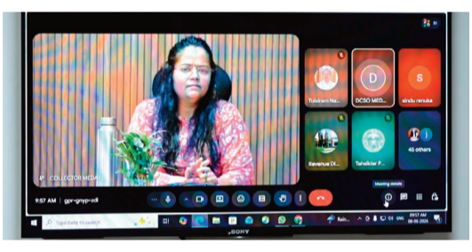
మెదక్ జూన్, 08 (సిరి న్యూస్)