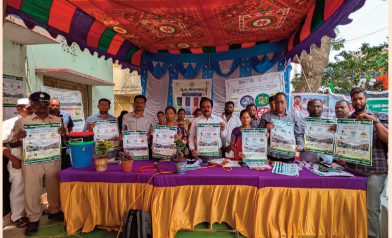
రామాయంపేట, (చేగుంట) జూన్ 8 (సిరి న్యూస్)

గ్రామంలో ప్రజల సమస్యలను క్షేత్ర స్థాయిలో పరిష్కరించేందుకు గ్రామ సభలు సమర్థవంతమైన వేదికగా నిలుస్తాయని జిల్లా అదనపు కలెక్టర్ నగేష్ అన్నారు. సోమవారం చేగుంట మండల కేంద్రంలోని గ్రామంలో ప్రజా పాలన ప్రగతి ప్రణాళిక 99 రోజుల కార్యక్రమంలో భాగంగా నిర్వహించిన గ్రామ సభలో జిల్లా అదనపు కలెక్టర్ సంబంధిత శాఖల అధికారులతో కలిసి పాల్గొన్నారు. ఈ సందర్భంగా అదనపు కలెక్టర్ మాట్లాడుతూ, ప్రజా పాలన ప్రగతి ప్రణాళికలో భాగంగా ఈ నెల 4, 6, 8, 10 తేదీలలో గ్రామ సభలు నిర్వహిస్తున్నామని తెలిపారు. ప్రతి గ్రామ సభలో వివిధ శాఖల అధికారులు తమ శాఖల ద్వారా అమలు చేస్తున్న కార్యక్రమాలు, ప్రజలకు అందుబాటులో ఉన్న సేవలపై అవగాహన కల్పిస్తున్నట్లు పేర్కొన్నారు. గ్రామ సభల ద్వారా గ్రామస్థుల సమస్యలను నేరుగా తెలుసుకొని త్వరితగతిన పరిష్కరించే అవకాశం కలుగుతుందని అన్నారు. ఎస్.ఐ.ఆర్ నమోదు ప్రక్రియ, ఎల్ఐసీ ప్రభావం నేపథ్యంలో రైతులు పంటలు సేద్యంపై తీసుకోవాల్సిన జాగ్రత్తలు, పారిశుధ్యం, కాలుష్య నియంత్రణ, సురక్షిత తాగునీటి నిర్వహణ తదితర అంశాలపై ప్రజలకు అవగాహన కల్పిస్తున్నామని తెలిపారు. ఈ కార్యక్రమంలో సంబంధిత శాఖల అధికారులు సిబ్బంది పాల్గొన్నారు.