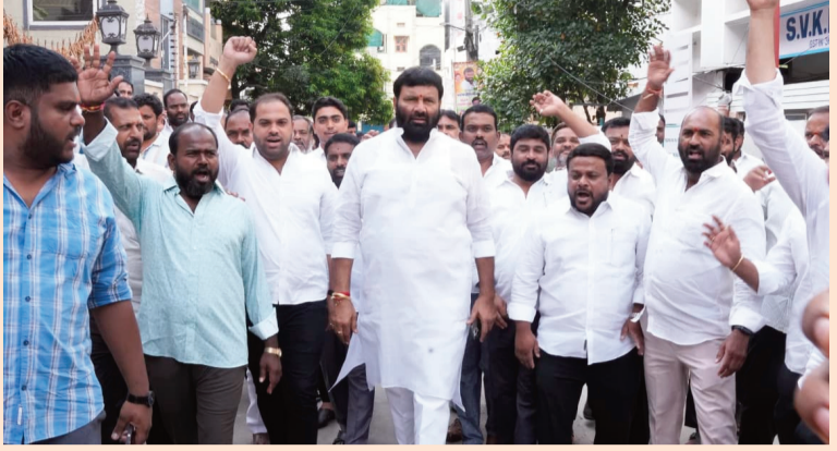
మేడ్చల్ మల్కాజ్జరి జిల్లా ప్రతినిధి జూన్ 8 సిరి న్యూస్

మియాపూర్ చౌరస్తాలో ఏర్పాటు చేసిన ముఖ్యమంత్రి రేవంత్ రెడ్డి భారీ బహిరంగ సభకు తన నివాసం నుండి భారీగా కాంగ్రెస్ శ్రేణులతో కలిసి వెళ్లడం జరిగింది. ఈ సందర్భంగా వారు మాట్లాడుతూ రేవంత్ రెడ్డి బాచుపల్లి ప్రజలు ఎదుర్కొంటున్న ట్రాఫిక్ సమస్యను నేటితో పరిష్కారం కానున్నదన్నారు. సుమారు 150 కోట్ల రూపాయలతో నిర్మించిన బాచుపల్లి ఫ్లైఓవర్ రేపటినుండి ప్రజలకు అందుబాటులోకి రావడం అభినందనీయమని, అదేవిధంగా సైబరాబాద్ మునిసిపల్ కార్పొరేషన్ ప్రధాన కార్యాలయాన్ని శంకుస్థాపన నేపథ్యంలో స్థానిక సైబరాబాద్ ప్రజలకు మెరుగైన సేవలు అందుతాయని తెలియజేశారు. ఈ కార్యక్రమంలో కాంగ్రెస్ పార్టీ నాయకులు కార్యకర్తలు పెద్ద సంఖ్యలో పాల్గొన్నారు.