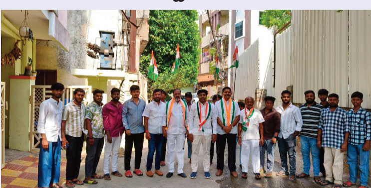
కొంపల్లి, జూన్.08(సిరి న్యూస్).