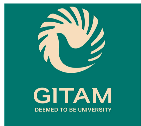
స్నెస్, సమాచార సాంకేతికత లేదా సంబంధిత విభాగంలో బ్యాచిలర్ డిగ్రీ కలిగిన అభ్యర్థులు దరఖాస్తు చేసుకోవచ్చని

గీతం డీప్స్ విశ్వవిద్యాలయంలోని అధునాతన సాంకేతిక పరిష్కారాల కేంద్రం (సీవీఐఎస్) అనుభవజ్ఞులైన డాట్ నెట్ డెవలపర్ల నియామకానికి నోటిఫికేషన్ విడుదల చేసింది. ఆసక్తి గల అభ్యర్థులు ఈ నెల 13, 14 తేదీల్లో నిర్వహించే ప్రత్యక్ష ఇంటర్వ్యూలకు హాజరుకావచ్చని సోమవారం విడుదల చేసిన ప్రకటనలో పేర్కొంది. పటిష్టమైన సాఫ్ట్వేర్ పరిష్కారాల రూపకల్పన, అభివృద్ధి, అమలులో 3 నుంచి 20 సంవత్సరాల అనుభవం కలిగిన నిపుణుల కోసం ఈ నియామక ప్రక్రియ చేపట్టిస్తుంది. తెలిపింది. అభ్యర్థులకు ఏఎస్ఐ డాట్ నెట్, ఎంపీఐ, డాట్ నెట్ కోర్, వెబ్ డివలప్, ఎస్కూఎల్ సర్వర్ డేటాబేస్ సాంకేతికతలలో బలమైన సాంకేతిక నైపుణ్యం ఉండాలని స్పష్టం చేసింది. కంప్యూటర్