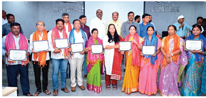
మెదక్, జూన్ 09 (సిరి న్యూస్)