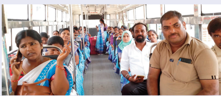
వెల్పర్తి, జూన్ 09, (సిరి న్యూస్):