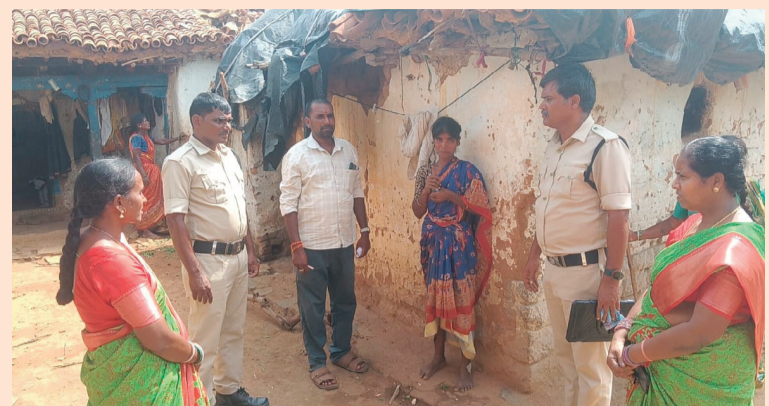
వెల్దురి, జూన్ 15, (సిరి న్యూస్) :