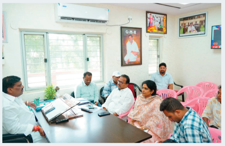
రామచంద్రపురం (పటాన్చెరు), జూన్ 15 (సిరి న్యూస్):

అమీన్ న్యూస్, పటాన్చెరు సర్కిళ్ల పరిధిలో కొనసాగుతున్న అభివృద్ధి పనులను నిర్దిత గడువులోగా పూర్తి చేసి ప్రజలకు అందుబాటులోకి తీసుకురావాలని పటాన్చెరు ఎమ్మెల్యే గూడెం మహిపాల్ రెడ్డి అధికారులను ఆదేశించారు. సోమవారం నిర్వహించిన సమీక్ష సమావేశంలో రెండు సర్కిళ్ల పరిధిలోని తొమ్మిది డివిజన్ లో చేపడుతున్న అభివృద్ధి పనుల పురోగతిని ఆయన సమీక్షించారు. నూతన కాలనీలో చేపడుతున్న రోడ్లు, డ్రైనేజీలు, ఇతర మౌలిక సదుపాయాల పనులను వేగవంతం చేసి గడువులోగా పూర్తి చేయాలని సూచించారు. వరకాలం ప్రారంభమైన నేపథ్యంలో పారిశుధ్య నిర్వహణకు అత్యంత ప్రాధాన్యత ఇవ్వాలని పేర్కొన్నారు. చెత్త తొలగింపు చర్యలను ముమ్మరం చేయడంతో పాటు కాలువలను శుభ్రంగా ఉంచి, దోమల నివారణ చర్యలు చేపట్టి సీజనల్ వ్యాధులు ప్రబలకుండా చూడాలని అధికారులను ఆదేశించారు. బోల్లారం స్టేడియం, పాటి వివేకానంద స్టేడియం అభివృద్ధికి నిధులు మంజూరైనట్లు అధికారులు తెలిపారు. త్వరలోనే అభివృద్ధి పనులు ప్రారంభం కానున్నట్లు వెల్లడించారు.