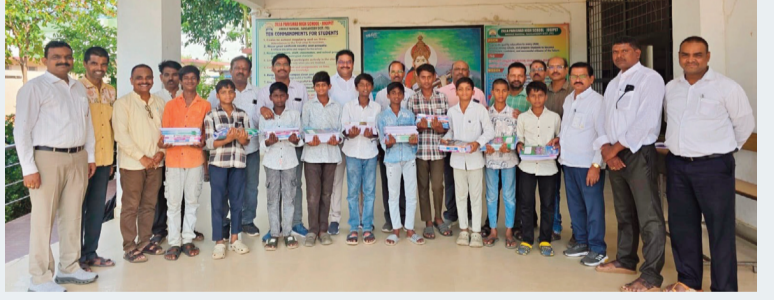
జోగిపేట, జూన్ 15, సిరి న్యూస్ :

● జోగిపేటలో విద్యార్థులకు పాఠ్యపుస్తకాలు, నోటు బుక్కుల పంపిణీ