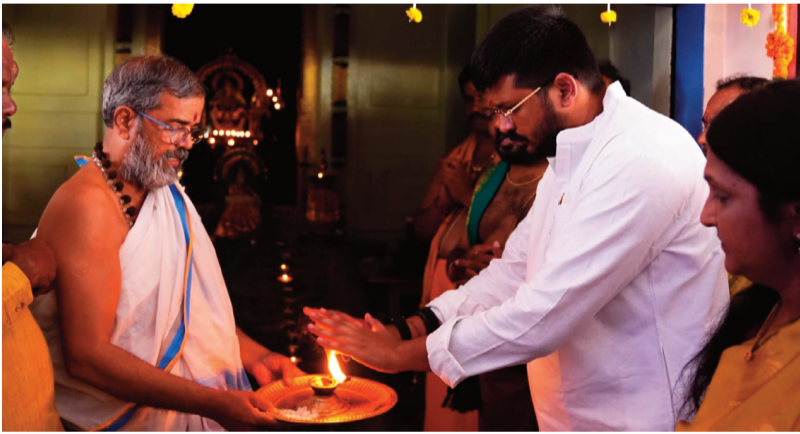
రామాయంపేట, (మెదక్) జూన్ 15 (సిరి న్యూస్)

అయ్యప్పస్వామి దేవాలయ రజతోత్సవ వేడుకల్లో భాగంగా సోమవారం మహాగ ఐదవ పూజ వైభవంగా జరిగింది. పుణ్యహ వాచనం, అఖండ దీపస్థాపన శివానంద లహరి పారాయణం నిర్వహించారు. సాయంత్రం మహాలింగార్చన, ప్రదోష పూజ చేపట్టారు. రెండవరోజు భక్తిశ్రద్ధలతో హోమం, ధ్వజారోహణం నిర్వహించగా, వేదపండితులు సామవేద పారాయణం పఠించారు. మెదక్ ఎమ్మెల్యే డాక్టర్