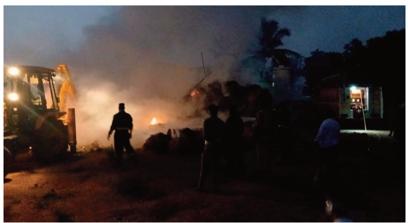
తూప్రాన్ జూన్ 15 సిరి న్యూస్

తూప్రాన్ మున్సిపల్ పట్టణంలోని ఏబి కాలనీలో సోమవారం సాయంత్రం ప్రమాదవశాత్తు గడ్డివాము లో మంటలు వ్యాపించడంతో సమాచారం తెలుసుకున్న