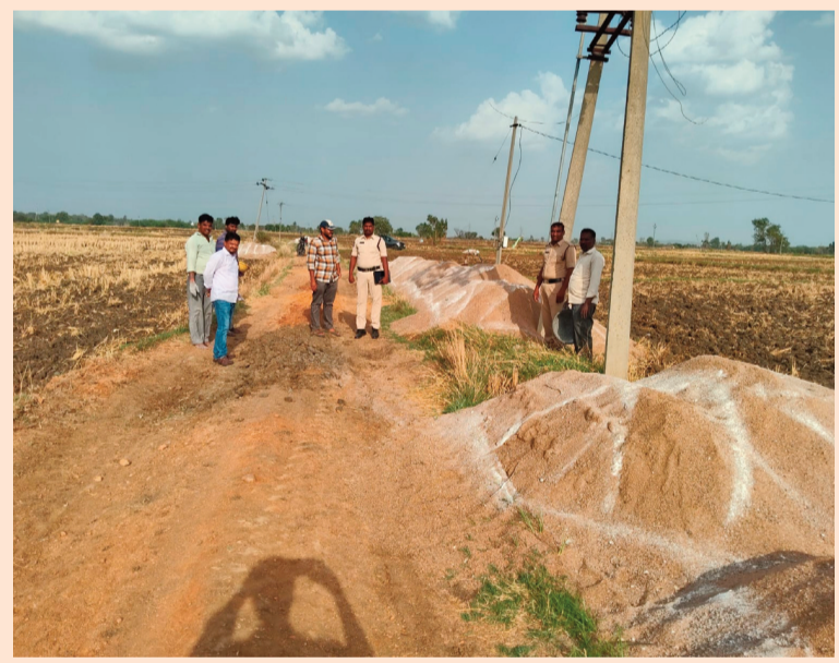
పాపన్నపేట్ జూన్ 15 (సిరి న్యూస్) :

కోరోజు మధ్యాహ్నం సమయంలో కుర్తివాడ గ్రామ శివారు యందలి మంజీరా నది నుండి పలుచోట్ల అక్రమంగా నిల్వ ఉంచిన ఇసుక నిల్వలను గుర్తించితిమి, ఇట్టి ఇసుక నిల్వలను మూడు గా 50 - 60 ట్రాక్టర్ల ఇసుక కలదని గుర్తించినాము. ఇట్టి ఇసుక నిల్వలను అక్రమమైనవి అని నిర్ధారితమైనది. కావున గ్రామ పాలన అధికారి సమక్షంలో సీజ్ చేసి అతని సంరక్షణలో ఉంచవలసింది..