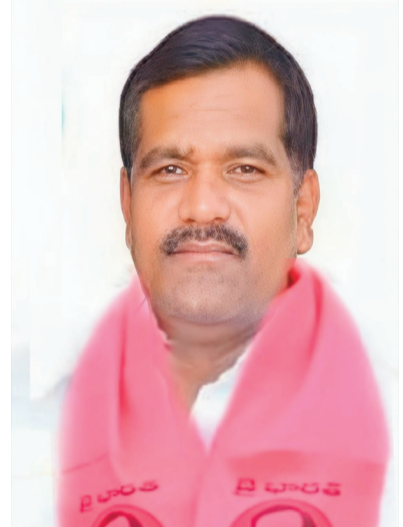
తరలకు విద్యను దూరం చేయవద్దని, ప్రభుత్వ పాఠశాలలను మూసివేయాలనే ఆలోచన చారిత్రక తప్పిదం అవుతుంది.

రాష్ట్రంలో 23 వేల ప్రభుత్వ పాఠశాలలను మూసివేస్తామంటూ ముఖ్యమంత్రి ఎ. రేవంత్ రెడ్డి ఇటీవల బెంగళూరులో చేసిన ప్రకటనను మెడక్ మాజీ ఎమ్మెల్యే పట్టోళ్ళ శశిధర్ రెడ్డి తీవ్రంగా తప్పుబట్టారు. ఈ నిర్ణయాన్ని ముఖ్యమంత్రి వెంటనే ఉపసంహరించుకోవాలని డిమాండ్ చేస్తూ ఆయన సీఎంకె సోమవారం నాడు ఒక బహిరంగ లేఖ విడుదల చేశారు. వచ్చే