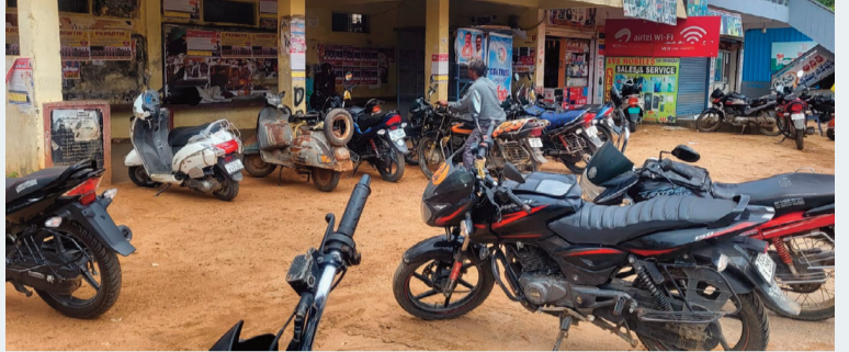
గుమ్మడిదల, జూన్ 15 (సిరి న్యూస్):

● ప్రయాణికుల కోసం నిర్మించిన షెల్టర్ వాహనాల అడ్డంగా మారిన వైనం