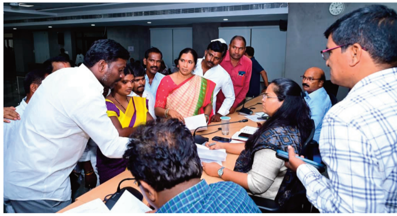
తిరిగి ప్రారంభించి పూర్తి చేయించేలా కలెక్టర్ తో మాట్లాడి సమస్యను వివరించారు. ఇందిరమ్మ పథకం కింద మంజూరైన ఇంటి నిర్మాణం అర్థాంతరంగా నిలిపివేసడం పట్ల ఆందోళన వ్యక్తం చేశారు. బాధిత కుటుంబానికి న్యాయం జరిగేలా వెంటనే విచారణ చేపట్టి తగిన చర్యలు తీసుకోవాలని కలెక్టర్ ను కోరారు. అద్దలైన లబ్ధిదారులు ప్రభుత్వ పథకాల ఫలాలను పొందేలా అధికారులు ప్రత్యేక శ్రద్ధ తీసుకోవాలని సూచించారు. సమస్యను త్వరితగతిన పరిష్కరించి, బాధిత కుటుంబానికి ఇల్లు నిర్మాణం పూర్తయ్యేలా చర్యలు చేపట్టాలని అధికారులను కోరారు.