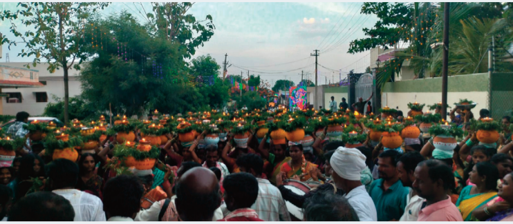
వెల్దురిజూన్ 20 (సిరి న్యూస్):