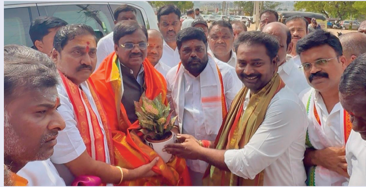
అమీన్సార్ జూన్ 20 సినీ న్యూస్

కుటుంబంతో కలిసి దైవ దర్శనం పూర్ణకుంభంతో ప్రత్యేక ఆహ్వానం మంత్రి తో కాటా శ్రీనివాస్ గౌడ్