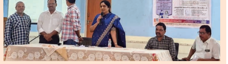
రామచంద్రపురం, జూన్ 22, (సిరి న్యూస్):

పటాన్ చెరు సర్కిల్ బిఎల్ఓలు, సూపర్ వైజర్లకు శిక్షణ