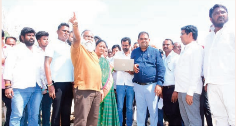
సంగారెడ్డి, జూన్ 22 (సిరి న్యూస్):

త్వరలో పనులు ప్రారంభించనున్న సీఎం రేవంత్ రెడ్డి