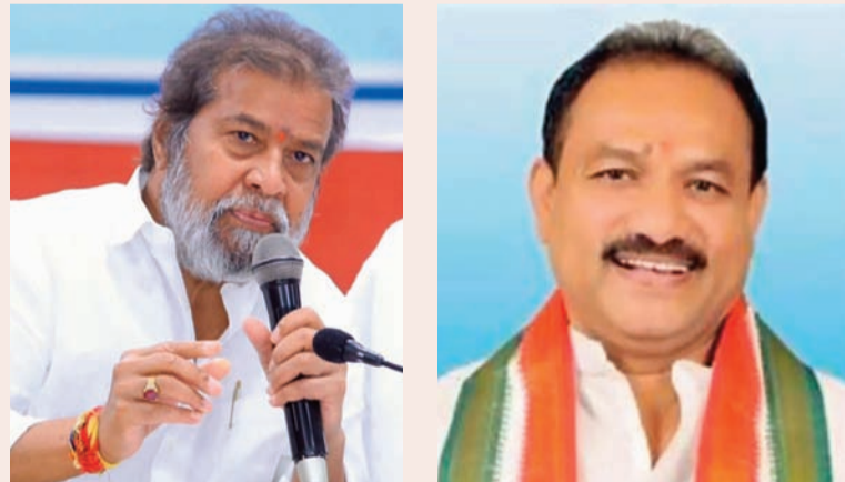
జోగిపేట, జూన్ 22, (సిరి న్యూస్):