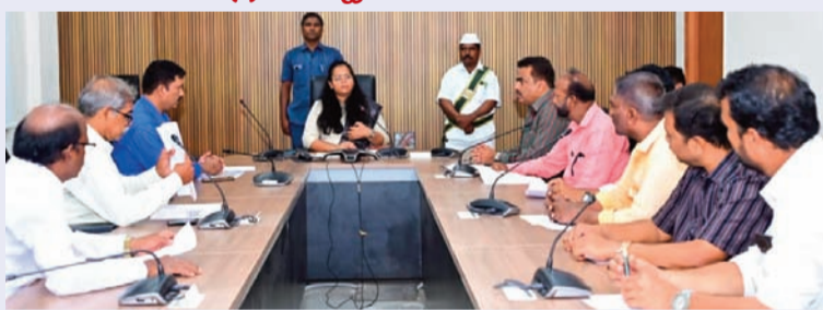
మెదక్, జూన్ 22 (సిరి న్యూస్)

జిల్లాలో అర్బులైన పౌరులందరూ ఈ ప్రత్యేక సమగ్ర సవరణ (సర్) కార్యక్రమంలో భాగస్వామ్యం చేయాలని, ఓటరు జాబితాలో తమ పేరును సరిచూసుకోవాలని జిల్లా ఎన్నికల అధికారి, కలెక్టర్ ప్రతిమాసింగ్ తెలిపారు. ఓటరు జాబితా సవరణ కార్యక్రమంపై గుర్తింపు పొందిన రాజకీయ పార్టీలతో సమావేశం నిర్వహించారు. ఈ సందర్భంగా జిల్లా కలెక్టర్ ప్రతిమాసింగ్ మాట్లాడుతూ, తప్పులు లేని ఓటరు జాబితా రూపొందించేందుకు అందరూ సహకరించాలని సూచించారు. సెషన్లలో ఇంటెన్సివ్ రివిజన్ కార్యక్రమం ఈ నెల జూన్ 25 నుండి జూలై 24 వరకు జరుగు తుందని తెలిపారు. గుర్తింపు పొందిన రాజకీయ పార్టీలు ప్రతి పోలింగ్ బాత్ కేంద్రానికి ఒక బాత్ ప్రతినిధిని నియమించి వివరాలు అందించాలన్నారు. బాత్ స్నాం అధికారులు (బి.ఎల్.ఓ.లు) ఇంటింటికి వెళ్లి సర్వే నిర్వహించారని, అర్బులైన ప్రతి ఒక్కరూ వారికి అవసరమైన వివరాలు అందించాలని కోరారు. ఓటరు జాబితాలో పేరు చేర్చడం, తొలగించడం, సవరణలు చేయడం వంటి సేవలను https://voters.eci.gov.in వెబ్సైట్ ద్వారా లేదా ఆన్లైన్లో కూడా చేసు కోవచ్చని తెలిపారు. అలాగే ఓటరు హెల్ప్లైన్ యాప్ ద్వారా కూడా దరఖాస్తులు చేసుకోవచ్చన్నారు.