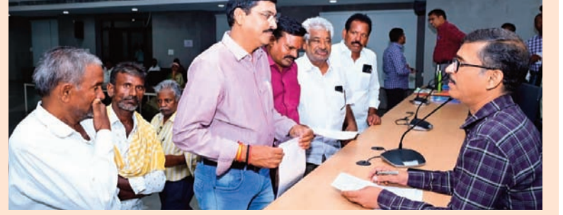
మెదక్, జూన్, 22 (సిరి న్యూస్)

ప్రజావాణి దరఖాస్తులను వెంటనే పరిష్కరించాలని డి ఆర్ ఓ అంబాదాస్ రాజేశ్వర్ అన్నారు. సోమవారం కలెక్టరేట్ లో నిర్వహించిన ప్రజావాణి లో పాల్గొన్నారు. ఈ కార్యక్రమానికి జిల్లాలోని పలు ప్రాంతాల నుంచి ప్రజలు వచ్చి దరఖాస్తులను అధికారులకు అందించారు. భూభారతి సమస్యలు 40, ఇందిరమ్మ ఇండ్లు 23, పెన్షన్ 4, ఇతర 33, మొత్తం 100 దరఖాస్తులను స్వీకరించారు. ఈ సందర్భంగా డిఆర్ఓ అంబాదాస్ రాజేశ్వర్ మాట్లాడుతూ.. ప్రజల నుంచి వచ్చిన దరఖాస్తులను తక్షణమే పరిష్కరించి, ప్రజలకు న్యాయం చేయాలని అధికారులకు సూచించారు. ఈ కార్యక్రమంలో అధికారులు సిబ్బంది తదితరులు పాల్గొన్నారు.