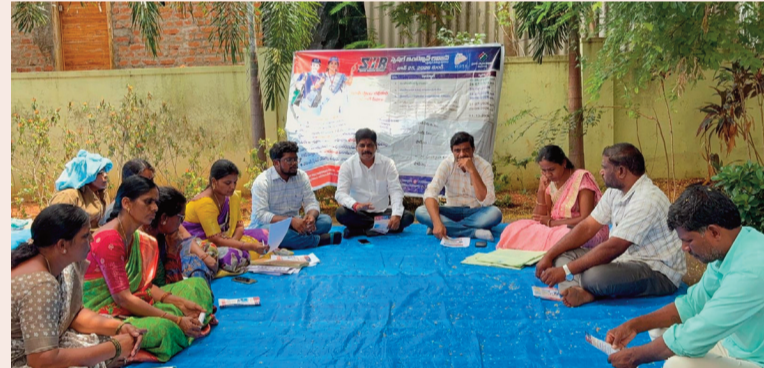
తూప్రాన్ జూన్ 23 సిరి న్యూస్