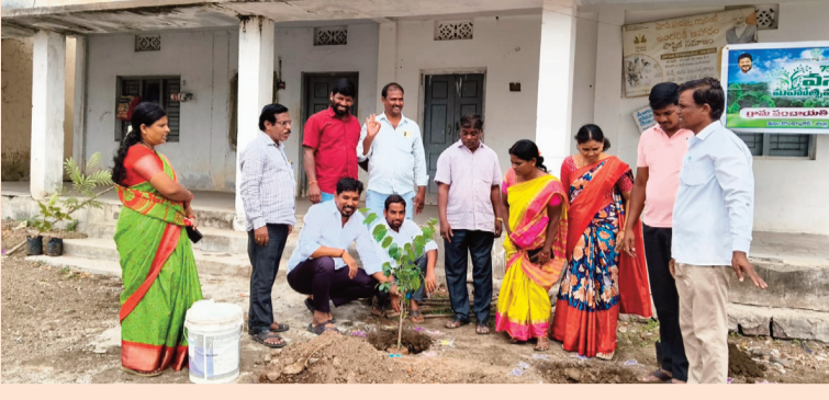
కొండాపూర్ జూన్ 23 (సిరి న్యూస్)