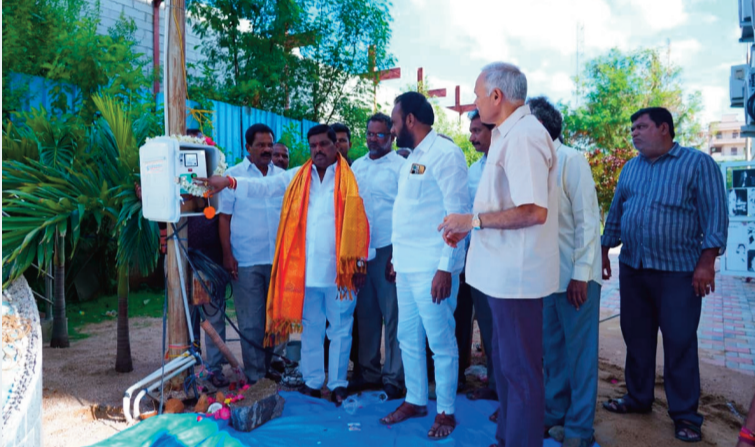
రామచంద్రాపురం, జూన్ 23, (సిరి న్యూస్):

ఎన్పీఎస్ఐ అవతార్ అపార్ట్ మెంట్ లో సొంత నిధులతో బోరు ప్రారంభం