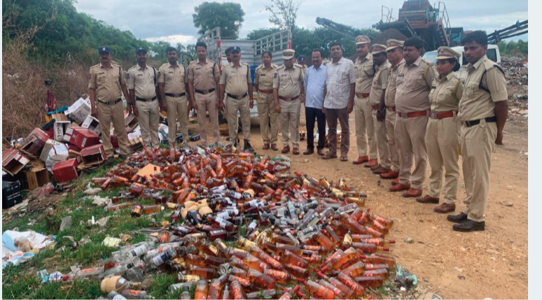
నర్సాపూర్ జూన్ 24 (సిరి న్యూస్)

నర్సాపూర్ పట్టణంలో డంపింగ్ యార్డ్ లో 950 మద్యం సీసాలను ఎక్సైజ్ అధికారులు బుధవారం ధ్వంసం చేశారు కాగజ్ మద్దూర్ గ్రామ శివారులో మరొక బయో మెడికల్ పరిశ్రమలో భాగంగా 783 విదేశీ మద్యం బాటిల్స్ ఫిబ్రవరి 23 ఎక్సైజ్ అధికారులు పట్టుకున్నారు అప్పుడు ఈ సంఘటన తీవ్ర కలకలం రేపింది ఈ మద్యం చూసి ఎక్సైజ్ అధికారులు అవాక్కయ్యారు వీటి అంచనా సుమారుగా 40 లక్షల రూపాయలు ఉంటాయని వివేచితో పాటు వివిధ కేసులలో అభించిన 167 మద్యం బాటిల్స్ ఎక్సైజ్ అధికారులు ధ్వంసం చేశారు