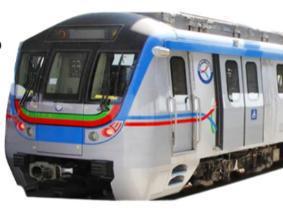
తెలంగాణ బ్యూరో, సిరి న్యూస్: