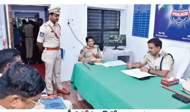
కమ్యూనిటీ పోలీసింగ్ తో అవగాహన..

కార్యాలయ రికార్డులను పరిశీలించిన డీజిజీ.. ఎస్పీ, ఎస్సీ అట్రాసిటీ, పోక్సో, అత్యాచార, వరకట్టు మరణాల కేసుల్లో నాణ్యమైన దర్యాప్తు చేపట్టాలని అధికారులను ఆదేశించారు. దీరకాలంగా పెండింగ్ లో ఉన్న మిస్సింగ్, ఎన్ బీడబ్ల్యూ కేసుల ఛేదనకు సబ్-డివిజన్ స్టాయిల్ ప్రత్యేక బృందాలను ఏర్పాటు చేసి త్వరితగతిన పరిష్కరించాలన్నారు. జహీరాబాద్ వేగంగా అభివృద్ధి చెందుతున్న పట్టణమని, 'నిమ్స్' రాకతో ఉపాధి అవకాశాలతో పాటు ఆర్థిక నేరాలు కూడా పెరిగి ఆస్కారం ఉందని హెచ్చరించారు. కమ్యూనిటీ కాంట్రాక్ట్ కార్యక్రమాల ద్వారా అనుమానాస్పద వ్యక్తులు, వాహనాలపై నిఘా ఉంచాలన్నారు. ఇది రాష్ట్ర సరిహద్దు ప్రాంతం కావడంతో ఇతర రాష్ట్రాల నుంచి అక్రమ రవాణా జరగకుండా చెక్ పోస్టుల వద్ద పకడ్బందీ చర్యలు చేపట్టాలని, భాక్ట్ స్కాల్ ల వద్ద సీసీ కెమెరాల నిఘాను కట్టుదిట్టం చేయాలని సూచించారు. పోలీస్ స్టేషన్ కు వచ్చే ఫిర్యాదిదారులతో మర్యాదగా ప్రవర్తించాలని, వారి సమస్యలను ఓపికగా విని న్యాయం చేస్తామనే భరోసా కల్పించాలని సిబ్బందికి డీజిజీ సూచించారు. ప్రతి ఫిర్యాదును ఆన్ లైన్ లో సమూహం చేసి, నిర్దిత గడువులోగా సీసీటిఎన్ఎన్ లో అటోలోడ్ చేయాలన్నారు. స్టేషన్ పరిధిలోని రౌడీ షీటర్లు, సస్పెక్ట్ ఖాస్టర్ షీటర్ల వివరాలను ఎప్పటికప్పుడు సమీక్షించి ఆన్ లైన్ లో సమూహం చేయాలని ఆదేశించారు.