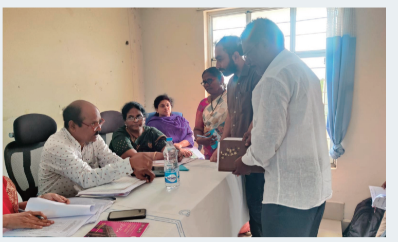
మెదక్, జూన్, 24