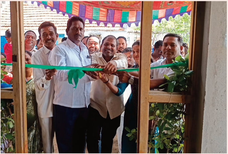
మంచిర్యాల, జూన్ 24 (సిరి న్యూస్)